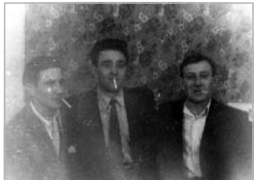
KOMLÓ, 1956. NOVEMBER 11.

„...A rádióban beolvasták a forradalmi tanács kérését és a vidék erre legjobb belátása szerint reagált. Így történt meg, hogy egyik földhívásukban szentet kértek a komlói bányászoktól a fővárosi kórházak részére. Mi azonnal megpakoltunk negyven kamiont, élelmiszert és fegyvereket is álcázva ezáltal, és elindultunk a főváros felé. Igen ám, de nem tudhattuk, merről lehet bejutni