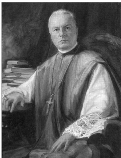
PROHÁSZKA OTTOKÁR PÜSPÖK

és úgy a püspökök, mint az igazgatótanács ajánlását, saját jelölésével együtt a minisztérium útján a főkegyúrhoz fölterjeszti.