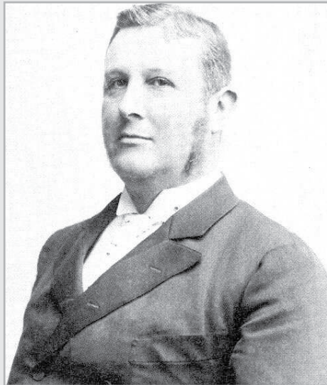
WEKERLE SÁNDOR VOLT A MINISZTERELNÖK AZ EGYHÁZPOLITIKAI VITÁK IDEJÉN

1890 és 1895 között a szabadelvű kormány a függetlenségük egy részével és több más ellenzéki csoporttal szövetkezve kidolgozta, majd végül – bosszas társadalmi és politikai vita után – bevezette az öt egyházpolitikai törvényt 1894-ben (a polgári házasságról, a gyermekek vallásáról, az állami anyakönyvekről) és 1895-ben (az izraelita felekezet recepiálásáról, a vallás szabad gyakorlásáról). Ezek a törvények főleg a római katolikus egyház érdekeit sértették. Ennek eredményeként a politikai életben a hagyományos hatvanhetes-nyegvennyolcas oppozíció mellett megjelent a liberális-konzervatív szembenállás is, s 1895 januárjában létrejött a – klerikális befolyás alatt álló, Magyarország első modern politikai csoportosulásának tartott – katolikus Néppárt.