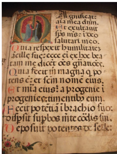
Foto 2 Cod. 3, Salterio, c. 39.