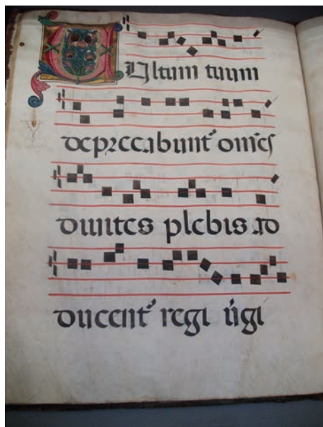
Foto 5 Cod. 31, Graduale, c. 20v