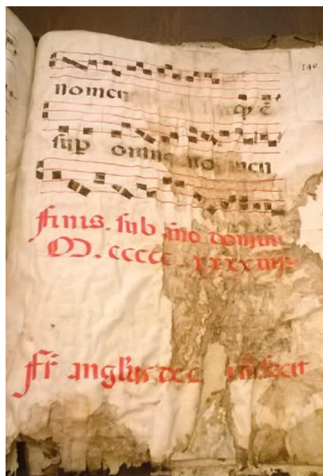
Foto 8 Cod. 26, c. 140v