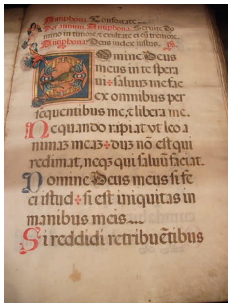
Foto 6 Cod. 15, Innario, c. 7