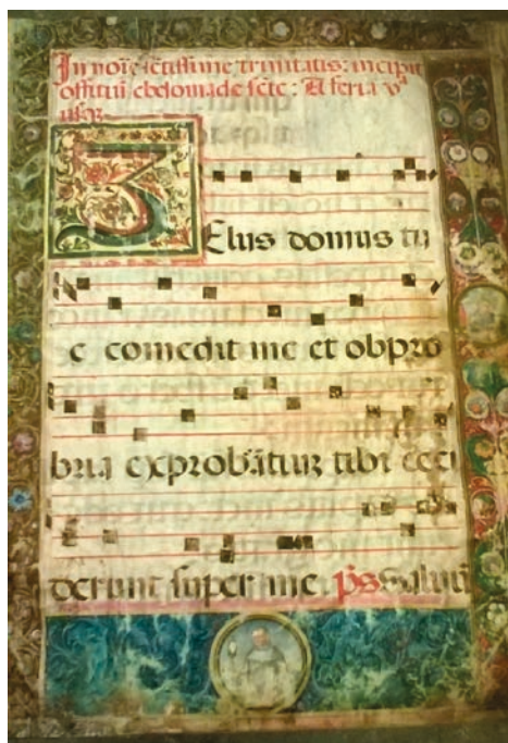
Foto 7 Cod. 26, Antifonario, c. 1