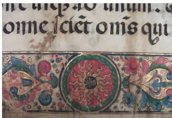
Foto 4 Cod. 18, particolare