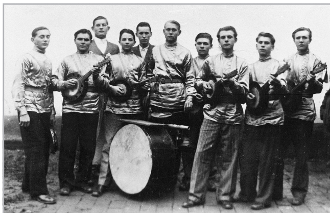
A PITVAROSI SZLOVÁK BALALAJKA ZENEKAR A KITELEPÜLÉS ELŐTT