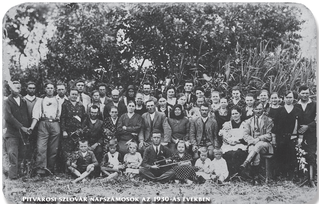
PITVAROSI SZLOVÁK NAPSZAMOSOK AZ 1930-AS ÉVEKBEN

A Csanád megyei települések közül leginkább Pitvarost érintette a lakosságcsere és annak valamennyi – mindmáig kiható – következménye. A csaknem kétezer Csehszlovákiába települő szlovák helyére közel ugyanannyi felvidéki magyart telepítettek be (többségüket a csallóközi Gútáról).