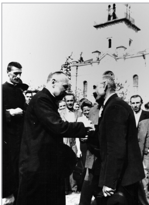
MINDSZENTY JÓZSEF ESZTERGOMI ÉRSEK PITVAROSON A FELVIDÉKRŐL KITELEPÍTETT MAGYAROK KÖZÖTT

Egy hónappal későbbi – 1947. május 31-én kelt – beszámolójában az alispán arról írt,