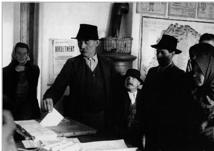
1947. AUGUSZTUS 31. SZAVAZÁS VIDÉKEN A „KÉK- CÉDULÁSKÉNT” ELHÍRESÜLT VÁLASZTÁSOKON

A BESZÉLGETÉST HAÁG ZALÁN ÉS MIKLÓS PÉTER KÉSZÍTETTE