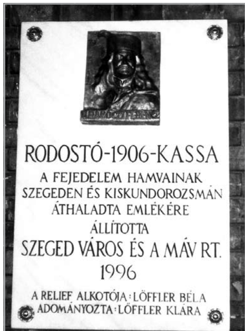
A RÁKÓCZI-RELIEFET ONTOTT BRONZ BETŰS FEHÉR MÁRVÁNYTÁBLÁRA HELEYZTÉK