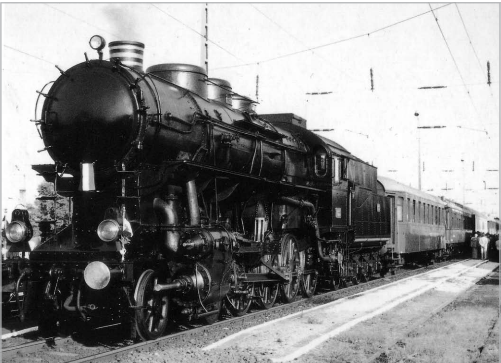
A MÁV 424.009 PÁLYASZÁMÚ NOSZTALGIAGŐZÖSE

vonalon közlekedett, amelyen a legnagyobb magyar szabadságharcos hamvait szállították. A századfordulós kocsikban korabeli ruhákba öltözött hölgyek várták azt a százötven utast, akik a Nyugati pályaudvaron még a Ferenc József számára készült Királyi Váróteremből indultak a szabadságharcos fejedelem főbb állomásai felé. A hat kocsiból álló szerelvényben Rákóczival kapcsolatos relikviák, zászlók és fényképek is helyet kaptak és étkezőkocsi is volt. A vonatot 424-es sorozatú gőzmozdony továbbította. A vonat először Miskolcon, Rákóczi egykori lakóhelyén állt meg, majd Sárospatak következett, ahova zászlókkal feldíszített állomásra érkezett a vonat, és a vendégeket hagyományörző lovasok fogadták. Az első napi program Sátoraljaújhelyen ért véget, ahol ünnepi színházi előadás volt. Másnap Kassán, a Szent Erzsébet székes-egyház előtt tartott megemlékezésen vettek