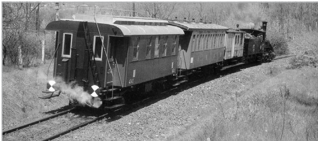
ILYEN ÉS HASONLÓ KOCSIKBAN UTAZTAK KASSÁRA AZ EMLÉKVONAT UTASAI (A KÉP ILLUSZTRÁCIÓ)

„A magyar történelem kiváló alakjai közül egyedül II. Rákóczi Ferenc hamvai nyugszanak idegen földön, s a hamvak hazaszállítása a nemzetnek ismételten kifejezett közóhaját képezi. Hála legyen érte az isteni gondviselésnek: azok az ellentétek és félreértések, amelyek súlyosan nehezédtek elődeinkre hosszú századokon át, ma már egy végképp letűnt korszak történelmi emlékeit képezik. Király és nemzet kölcsönös bizalma és az alkotmány visszaállított békés uralma megteremtették a trón és a nemzet között a sikerült egyesült munkásság alapfeltételét képező összhangot. Keserűség nélkül gondolhatunk tehát vissza mindannyian a mögöttünk álló borús korszakra s király és nemzet egyesült kegyelete keresheti fel mindazok emlékezetét, kiknek vezető szerep jutott a letűnt küzdelemben. Ennélfogva utasítom, hogy II. Rákóczi Ferenc hamvai hazaszállításának kérdésével foglalkozzék és erre vonatkozó javaslatait elváróm.” 2