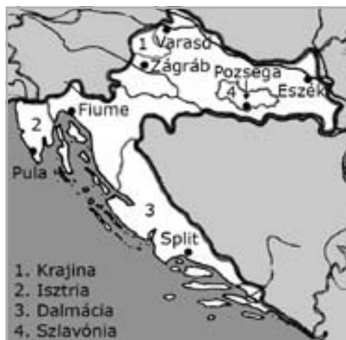
HORVÁTORSZÁG MA (FORRÁS: EURÓPA TÁRSADALOM- FÖLDRAJZA NÉVANYAG)

hat járásra volt felosztva: bródi-, daruvári-, novskai-, pakráci-, pozsegai-, újgradiskai járás, mindegyik járás székhelyének a neve megegyezik a járás nevével. A vármegye 1918-tól Jugoszlávia részévé vált, majd 1991-től a független Horvátország területéhez tartozik. Pozsega területén manapság gabona-, és gyümölcsstermesztéssel foglalkoznak, állattenyésztésen belül a sertésenyésztés igen jelentékeny. Ásványkincsei közül jelentős a kőszén, lignit, vasérc.