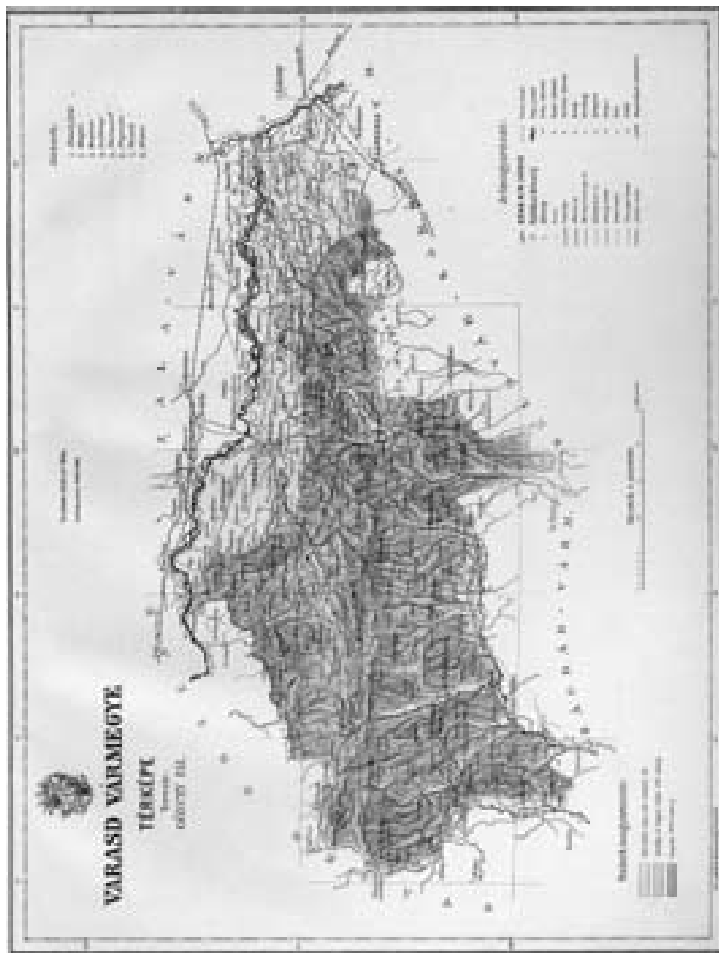
VÁRASD VÁRMEGYE TÉRKÉPE A GÖNCZY-KOGUTOWICZ-FÉLE MEGYEATLASZBAN