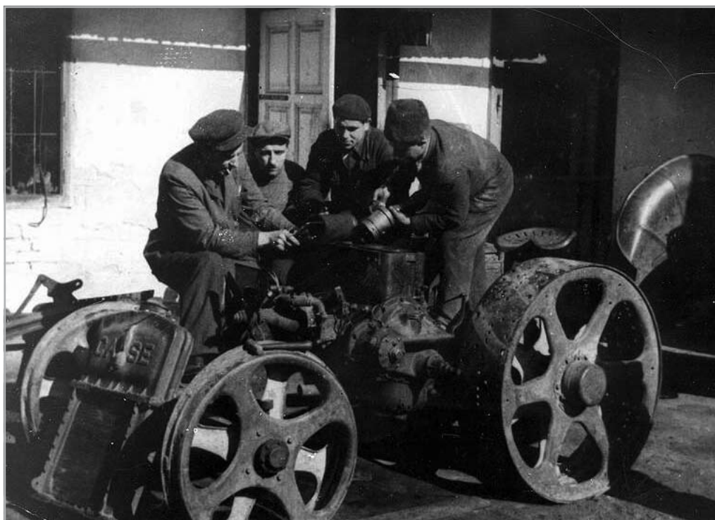
TRAKTORJAVÍTÁS EGY GÉPÁLLOMÁSON ( HTTP://MEK.NIIF.HU/01900/01906/HTML/INDEX1451.HTML )

ni kisgazdaságokat akartak. A közös gazdálkodás gondolata fel sem merült bennük, sőt, egy kisebbség ki-vételével, félelemmel elteleve gondoltak rá. A közös munkavégzésének egyetlen ismert példája a nagybirtok volt. A kolhozot csak az ellenséges propagandából ismerték, s ezt, még maguk választotta vezetőkkel sem kívánták. A földigénylők túlnyomó többsége egyéni tulajdonon alapuló, egyéni gazdálkodás híve volt. Sokan az egyéni gazdálkodást kiegészítő szövetkezés gondolatától azonban nem idegenkedtek. A törpe és kisbirtokosok sok helyen az országban szövetkezetekbe tömörültek szőlő, rizs egy-egy munkafolyamatának közös végzésére. 3