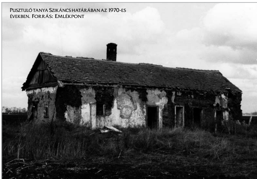
PUSZTULÓ TANYA SZIKÁNC S HATÁRÁBAN AZ 1970-ES ÉVEKBEN.

alkalmasak arra, hogy megindítsák a tanyák területi tömörülését