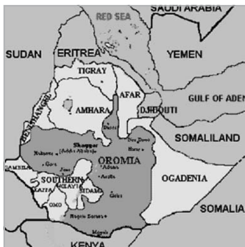
1. ÁBRA OROMIA ETIÓPIÁN BELÜLI FEKVÉSE

Bár az oromók Afrika egyik legnagyobb nemzete és az Afrika szarvának nevezett területen élő népesség jelentős részét képezik ma is, mégis számunkra jóformán ismeretlenek. A híres Etióp Birodalomban az oromók 42 milliós népessége alkotta a 72 milliós lakosság több, mint felét, és mai is hasonlóak az arányok, a 73.2 milliós népesség mintegy 36%-a oromó, kevesebb, 26% a vezető pozícióban lévő amhara, csupán 6%-nyi tigré és további kisebb létszámú csoportok mellett. A kolonizációs törekvések őket sem kerülték el, bár esetükben a kívülről jövő gyarmatosítók nem Európából érkeztek, hanem Abesszíniából, a körülöttük élő fekete, elsősorban amhara népesség, a XIX. századtól kezdve már az európaiak támogatásával, ami nyilván közrejátszott nehéz helyzetük kialakulásában.