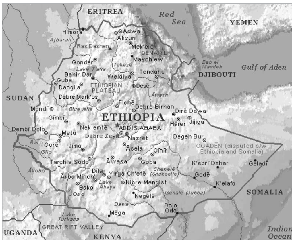
2. ÁBRA ETIÓPIA TERMÉSZETFDLDRAJZI TÉRKÉPE ÉS FŐBB TELEPÜLÉSEI FORRÁS: HTTP://MEMORY.LOC.GOV/CGI-BIN/MAP_ITEM

Egész Etiópia számára fontos az Awassa vize, amely nélkülözhetetlen áramforrás, és vizet szolgáltat a mezőgazdaság és ipar számára (pl. Wanji, Matahara stb. cukornád-, gyapot- és gyümölcsstermelő vidékein). Oromia egyedülálló vegetációja olyan növények eredeti otthona, mint a világszerte ismert kávé és valószínűleg itt ismerték fel elsőként a kávé serkentő hatását (Molnár, 2008). Ma is a kávétermesztés egyik központja.