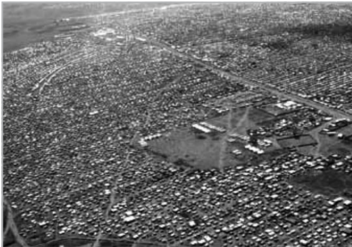
3. ÁBRA HUTU MENEKÜLTÁBOR TANZÁNIÁBAN

A ruandai események puskaporos hordóvá változtatták az amúgy sem stabil békéjű régiót. Az 1994 után következő első és második kongói háború kitérésében is szerepe volt a ruandai eseményeknek, arról nem beszélve, hogy a két millió hutu menekült, aki semmilyen megélhetést nem talált magának a százezres sátortáborokban, nagy tömegben állt be a Kongóban harcoló szabadcsapatokba. Szintén szerepet játszottak a ruandai események a burundi polgárháború alakulásában is, melynek során 1993 és 2006 között legkevesebb 300 ezer burundi állampolgárt gyilkoltak meg. Ruanda stabilitása rendkívüli mértékben függ a Kongó (korábban Zaire Köztársaság) keleti részén és Burundiban uralkodó állapotoktól, az országnak pedig a mai napig nagy gondot okoz, hogy a határ menti területeken még mindig sok százezer hazatérni vágyó ruandai hutu menekült él.