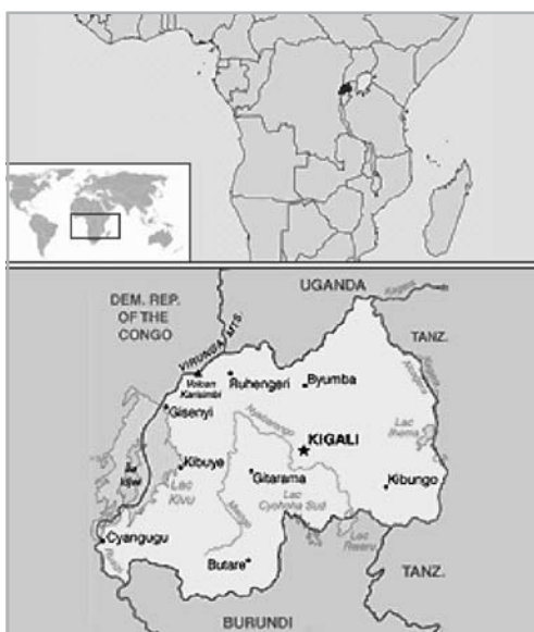
1. ÁBRA RUANDA HELYE AFRIKÁBAN

Ruanda területén a XV. századtól kezdve a földműveléssel foglalkozó hutuk voltak többségben és a nomád pásztorkodással foglalkozó tuszik alkották a kisebbséget. Ez a különbség, bár kezdetben még etnikai alapú volt, később, a gyakori keveredés miatt az