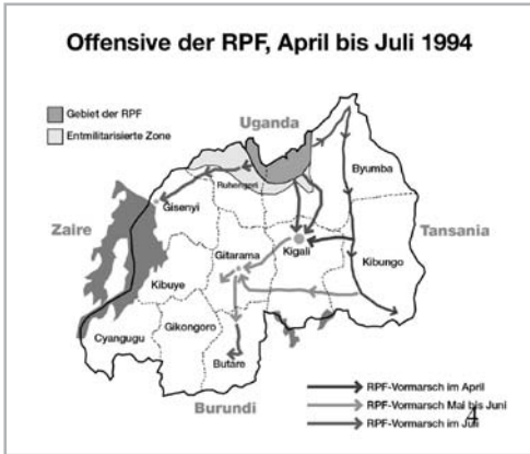
2. ÁBRA A KAGAME VEZETTE TUSZI RPF OFFENZÍVÁJÁNAK IRÁNYA

tagjai ugyancsak a menekülők között voltak, akik aztán bűnbándákba szerveződve ellenőrzésük alá vonták a menekülttáborokat, elkobozva az esetlegesen érkező segélyszállítmányokat a rászorulóktól, mindennaposá téve ezzel a menekültek terrorizálását. A tuszi hadsereg nem nyugodott bele, hogy a népirtó milíciák tagjai külföldre szöktek, ahonnan bármikor újra visszatérhetnek, ezért több rajtaütést hajtott végre a kelet-zairei menekülttáborokon. Sok onnan visszatérő embert is lemészároltak, illetve nehéztüzérséggel pusztították el Nyacyonga menekülttábort, több ezer ártatlan menekültet is megölve ezzel. A becslések szerint a tuszi büntetőakciók következtében újabb 60 ezer ember halt meg, köztük rengeteg civil. 18