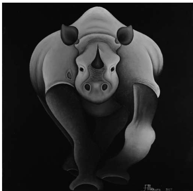
ABDUL MKURA: ORRSZARVÚ / RHINO BICIKLIZOMÁNC VÁSZON BYCICLE PAINT ON CANVAS 60×60 CM, 2007