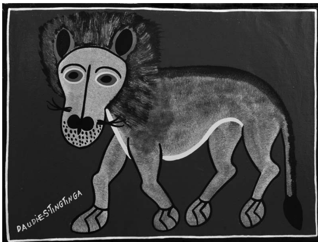
DAUDI E.S. TINGATINGA: OROSZLÁN / LION BICIKLIZOMÁNC VÁSZON BYCICLE PAINT ON CANVAS 40×30 CM, 2007