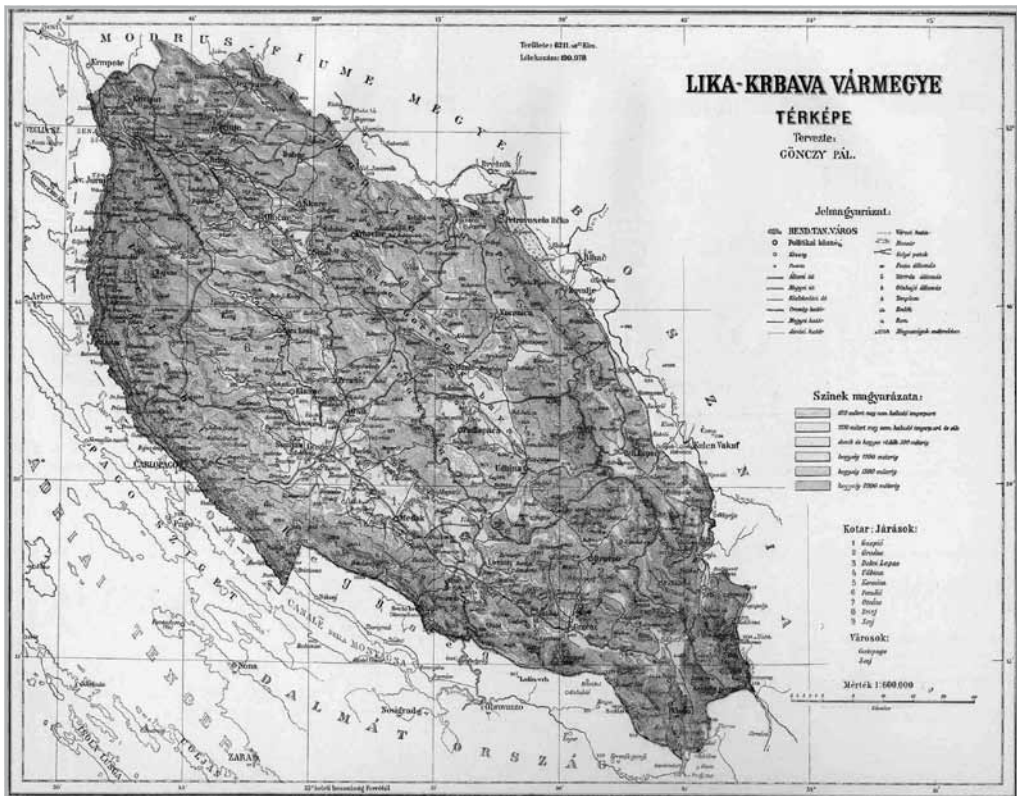
LIKA-KRBAVA VÁRMEGYE TÉRKÉPE A KOGUTOWICZ-FÉLE KÖZIGAZGATÁSI ATLASZBAN