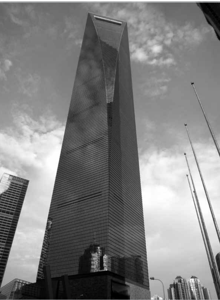
A VILÁG MÁSODIK LEGMAGASABB ÉPÜLETE, SHANGHAI WORLD FINANCIAL CENTER KÍNÁBAN ÉPÜLT FEL. DE UGYANITT MÁR ÉPÜLNEK AZ ÚJABB TRÓNKÖVETELŐK ( HTTP://UPLOAD.WIKIMEDIA.ORG/WIKIPEDIA/COMMONS/C/C8/SWFC3600PPX4.JPG )