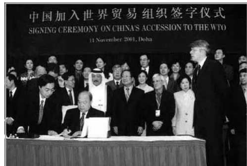
KÍNA ALÁÍRJA CSATLAKOZÁSÁT A KERESKEDELMI VILÁGSZERVEZETHEZ

Kína WTO tagságának fő kérdéskörét a tagországokkal megvalósuló kétoldalú kapcsolatainak rendezése jelentette. Ezek jórészt a felek között történtek Genfben (a WTO székhelyén), vagy az érdekelt országok fő-