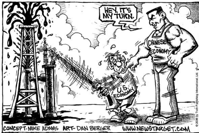
A KÍNAI GAZDASÁGI TELJESÍTMÉNY MEGIHLETI MÉG A KARIKATURISTÁT IS ( HTTP://GLOBALECONOMY.FOREIGNPOLICYBLOGS.COM/FILES/2009/12/CHINA-ECONOMIC-POWER-CARTOON.JPG )