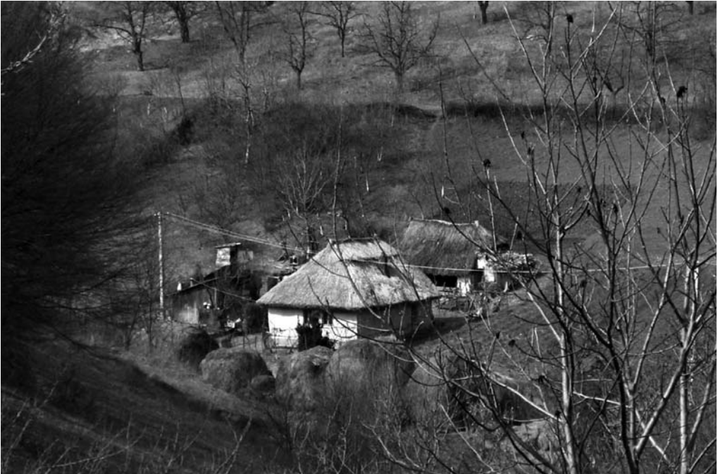
Régi ház az Újfaluban 2007. március 15-én készült

is. Visa környékén a XIV. század elején még három kisebb telek létezett, nevezetesen: Kőrös-telek, Varjad-telek és Búzös-telek. Nevük máig megőrződött olyan dülőnevekben, mint Kőrös, Varjas és Büdöstő. 16 A pusztítások, a székelyek kivonása Belső-Erdélyből, és az ezeket követő betelepítések miatt első ízben változott Közép-Erdély etnikai képe, a megritkult magyarság mellé szászok és bajorok kerültek. 17 Szolnok-Doboka vármegye monográfiája szerint IV. Béla korában a Visával szomszédos Szék lakói németek voltak. 18