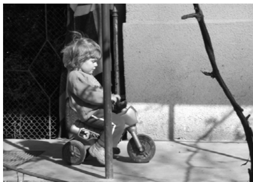
A modern kor játékaival játszó visai gyermek ❖ Gatti Beáta fotója 2007. március 15-én készült