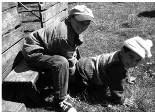
A juhokat fejő felnőtteket utánzó gyerekek Visában 2007. április 24-én készült

a játékfolyamat jellemzőinek összegyűjtésén alapul. 2 A játékeffektívumok egy tézisben azonosságot mutatnak, mely szerint a játék minden külső kényszerítő körülményt nélkülöző, szabad cselekvés. Ez a meghatározás azt sugallja, hogy a játék nem fontos, nem baj, ha kimarad az életünkből. Ám a játéknak igen fontos pszichológiai és társadalmi, 3 és nem utolsó sorban biológiai szerepe van.