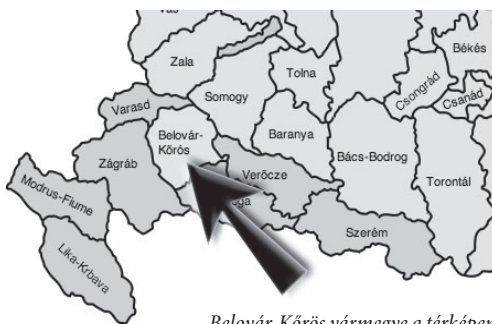
Belovar-Kőrös vármegye a térképen

részt a 190508 hektárnyi szántóföld tett ki. Ezenkívül 5660 hektár kert, 63314 hektár rét és 27616 hektár legelőt találhattunk Belovar-Kőrösben. Mezőgazdaságának legfontosabb terméke volt a gabonaneműk között a kukorica, amit mennyiség tekintetében a rozs követett, míg harmadik helyen a búza állt. Jelentős