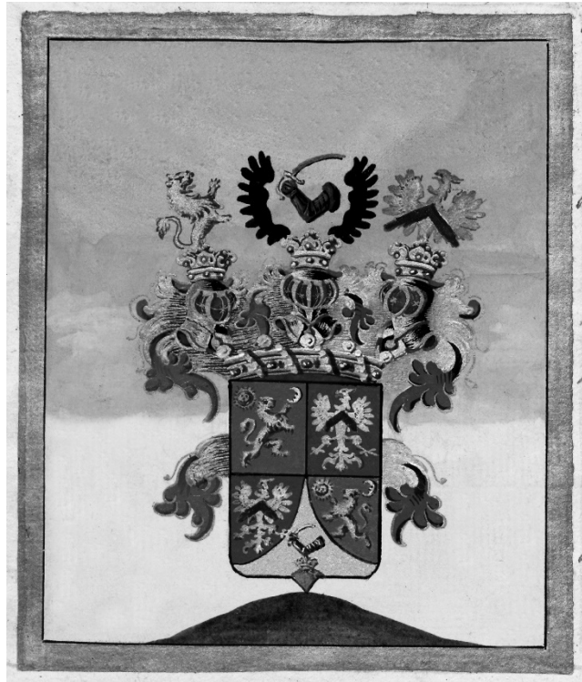
Horváth Mihály bárói címere 164