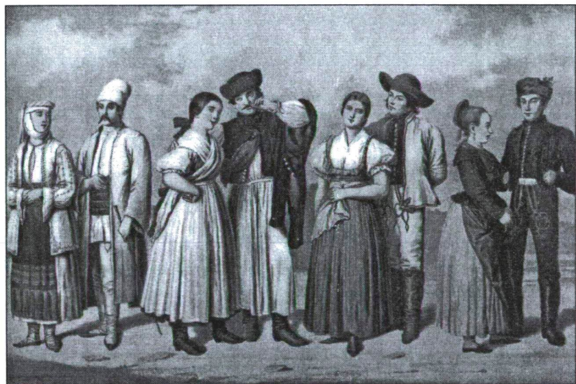
Magyarországi nemzetiségek jellegzetes viseletükben