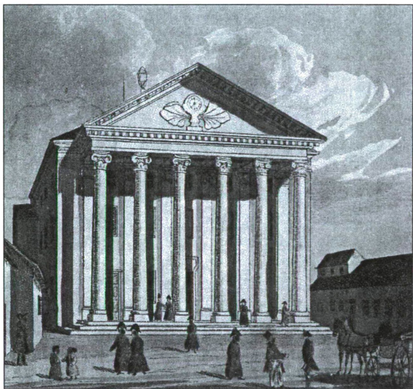
Az óbudai zsinagóga 1837-ben