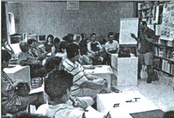
Apáczai Nyári Akadémia – A szülő öröme a boldog gyermek