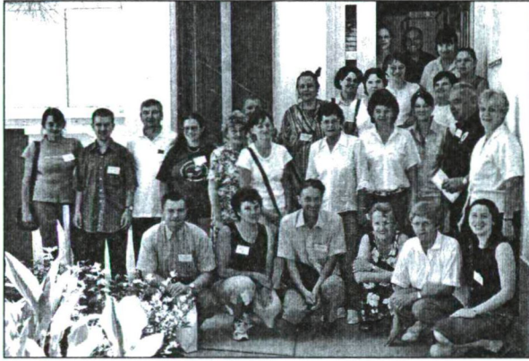
Apáczai Nyári Akadémia – Történelem és magyarság