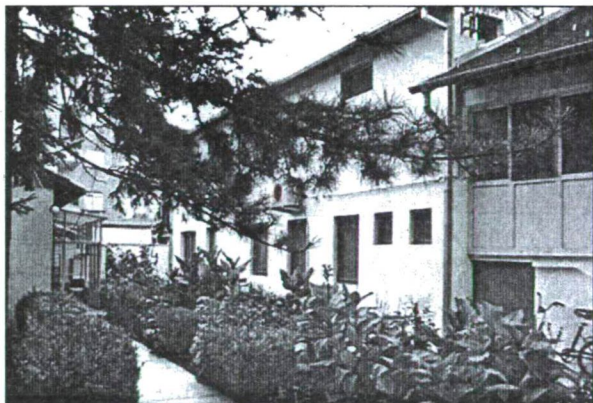
Az Apáczai Diákotthon új épülete

Egy újabb udvari épületet szintén Apáczai Közalapítvány és a Határon Túli Magyarok Hivatalának támogatásával építettünk. 2003-ban családi házat vásároltunk Újvidéknek a Telep nevű városnegyedében, most ennek bővítésére nyertünk támogatást az Apáczai Közalapítványtól, a 14 helyett 32 diák lakhat majd itt. Ez lesz a fiúkollégium. Oktatási programunk célja a megmaradásunk, a magyarságtudatot erősítjük a diákokban, ezért magyarságismereti előadásokat tartunk. Van karrierépítő programunk, angol nyelvi és számítógépes képzés.