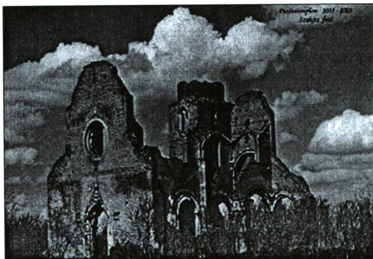
Az aracsi pusztatemplom