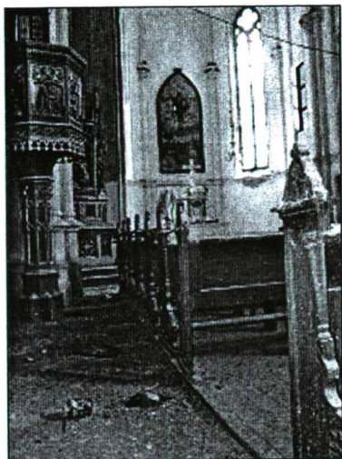
A módosi templom