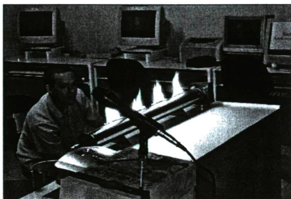
Apáczai nyári Akadémia – A természet egysége

A TANOM továbbképzésen tanítók, anyanyelvpolók, oktatók vesznek részt havonta egyszer, magyarországi és hazai előadók tartanak előadást.