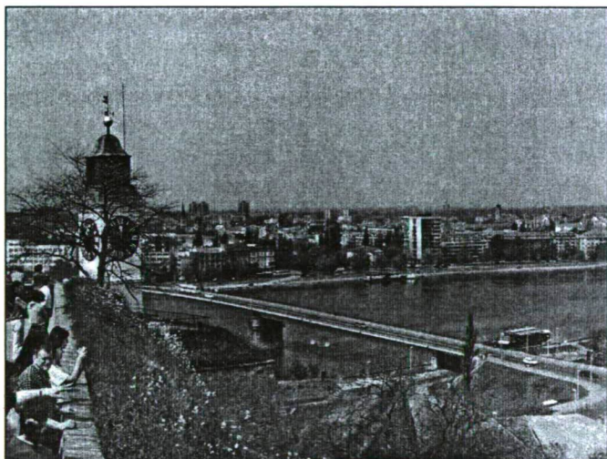
Újvidék látképe a várból