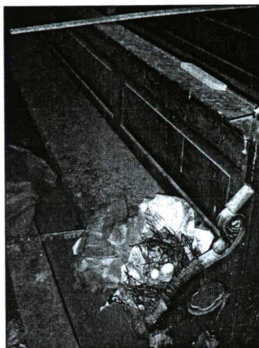
A padban galambfészek van