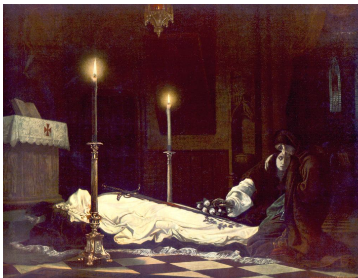
4. kép: Madarász Viktor: Hunyadi László siratása

háborúnak ugyan véget vetett, ám egyúttal egy új problémát, trónöröklési válságot idézett elő. A megüresedett magyar trónra pályázó külföldi uralkodók, mint III. Frigyes német-római császár és IV. Kázmér lengyel király, nem tudták érvényesíteni igényüket. 14 Az országból Újlaki Miklós macsói bán, Garai László nádor, valamint a Hunyadi család kívánt V. László örökébe lépni, ám közülük a Hunyadi-párt jelöltje, Hunyadi Mátyás látszott a legesélyesebbnek. Mivel feltét szándéka volt a Hunyadiak nevének régi fényét visszaállítani, Szilágyi Erzsébet teljes szívvel elkötelezte magát Mátyás trónra emelésének terve mellett, amiben fivére, Mihály is segítette. 15 Az asszony elküldte Vitéz János váradi püspököt Prágába, hogy az ott Podjebrád György cseh kormányzó felügyelete alatt tartott Mátyás kiváltásáról tárgyaljon (5. kép). Podjebrád 40 ezer arany forint váltságdíj fejében – amit a püspök Erzsébet pénzéből, az asszony nevében fizetett ki – megígérte, hogy miután Mátyást magyar királlyá választják, szabadon engedi őt. 16 A választáshoz azonban előbb békét kellett teremteni a Hunyadi-pártiak és ellenfelek között. Erre az 1458. január 12-én, Szegeden megkötött Szilágyi–Garai-egyezménnyel került sor, amivel megnyílt az út Hunyadi Mátyás trónra emeléséhez. 17