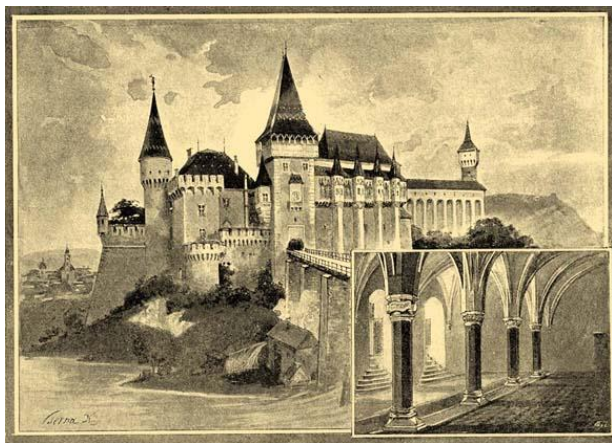
3. kép: Cserna Károly rajza Vajdahunyad váráról