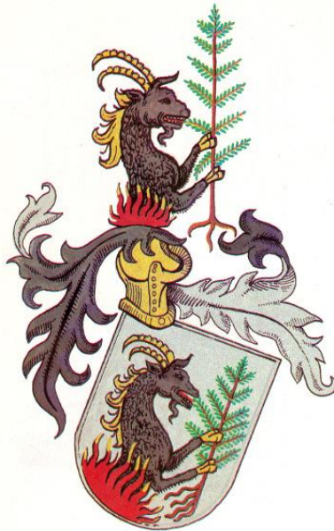
2. kép: A Szilágyi család címere (1409)

feltehetően 1428–1430 körül házasodtak össze. 8 Első ismert közös gyermekük, Hunyadi László 1431-ben jött a világra, majd Kolozsvárott, 1443. február 23-án született meg a pár második fia, Mátyás. 9