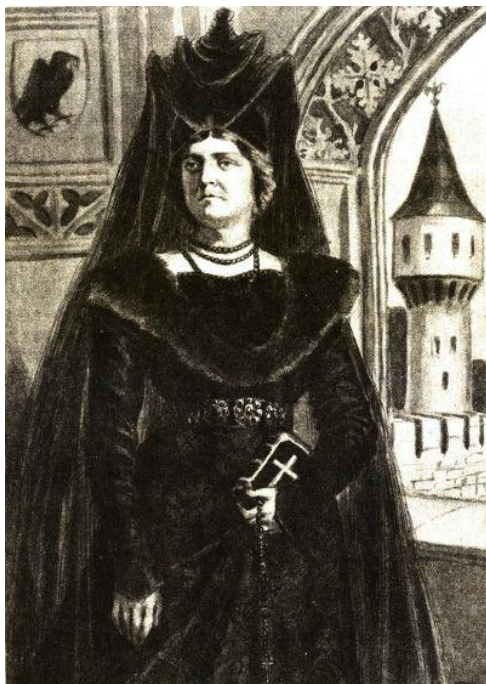
1. kép: Horogszegi Szilágyi Erzsébet

Horogszegi Szilágyi Erzsébet ( 1. kép ) a 15. századi Magyar Királyság neves nagyasszonya volt, akit az egyik leghíresebb nőként tartunk számon a magyar történelemben. Bár a nevére Arany János Mátyás anyja című verséből sokan emlékezhetnek, élete – egyes rövidebb szakaszoktól eltekintve – a szélesebb körű nyilvánosság előtt mégis nagyrészt ismeretlen. A Hunyadi-kort taglaló 19–20. századi magyar történeti szakirodalomban Erzsébet gyakorlatilag „mellékszereplőként” jelent csak meg. Ugyan az 1990–2000-es évek fordulóján, Teke Zsuzsa és Estók János nőtörténeti munkái révén Erzsébet nagyobb figyelmet kapott, forrásalapú életrajzi monográfia a mai napig nem készült róla. Hunyadi Mátyás királlyá választásának 560. évfordulója viszont ismét alkalmat nyújt arra, hogy a nagy uralkodó mellett az őt trónra segítő személyekről, köztük az édesanyjáról is megemlékezzünk.