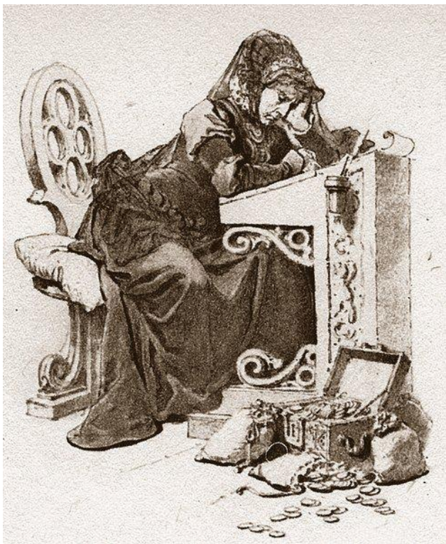
5. kép: Zichy Mihály rajza Arany János Máttyás anyja című verséhez