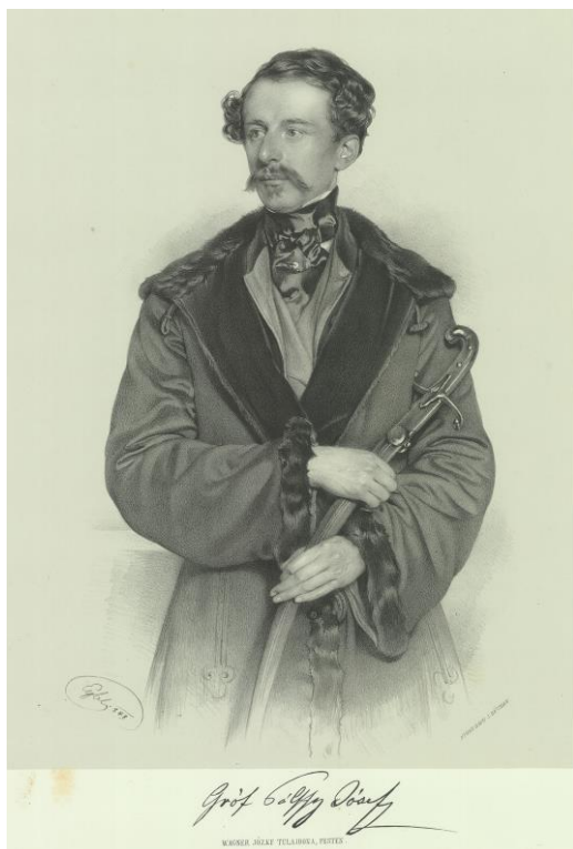
3. kép: Gróf Pálffy József – Franz Eybl litográfiája (1848)

minden közterhekben is részt vesz, a köztanácskozásból kizárni nem lehet; annyival inkább is kötelessége a törvényhozásnak, hogy ezen néposztálynak szavazati jogot adjon, s hogy ez a köztanácskozásokban részt vegyen és hogy ott hol a közterhek viseléséről van szó mellyeknek hordásában tetemes részt vesz, befolyással bírjon.” 15 A rendezés alappillére a „bekebelezés” volt, amely szerint a városok magukhoz csatolhattak volna olyan területeket, amelyekkel már összenőttek, de más törvényhatóság irányítás alatt álltak. A városoknak megengedték volna, hogy statutumokat hozhassanak, de azok hatálya nem terjedhetett volna túl a város határán, és azok hatályban lévő törvényekkel nem ellenkezhetek. A szabályrendeletek végrehajtását a Helytartótanács felügyelte volna. A konzervatív főrendek főfelügyelői intézményt is szerettek volna bevezetni (mintegy a megyei főispáni hivatal mintájára), de az ellenzékiek ezt határozottan elutasították, mivel a kormánzatnak még nagyobb befolyása lett volna a városok belügyeire, például a követ és tisztségviselő választásokra.