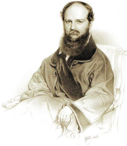
1. kép: Gróf Batthyány Lajos – Franz Eybl litográfiája (1842)

Az 1839/40. évi országgyűlés pozitívan zárult, 51 törvénycikket fogadtak el, melyeket az uralkodó is szentesített. A sikerhez az is hozzájárult, hogy ezen az országgyűlésen megszerveződött a liberális főrendi ellenzék Batthyány Lajos gróf (1. kép) vezetésével, aki létrehozott egy ellenzéki mágnás kaszinót 1839. június 10–11-én. Később létrejött egy úgynevezett kiskaszinó, az egyik ilyen kiskaszinói gyűlésen, 1839. november 18-án mondták ki a főrendi ellenzék megalakítását. 1