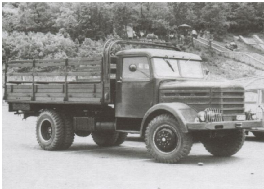
2. kép: A bevonulás során használt Csepel gyártmányú tehergépkocsi

Ez alapján a fő feladata az előre meghatározott célobjektumok elfoglalása és biztosítása volt. A legfontosabb célpont a Léván tartózkodó Csehszlovák Néphadsereg 64. harckocsi ezredének épületeinek elfoglalása volt, emellett pedig az ott tartózkodó ezred harcképtelenné tétele is fontos feladat volt. Erre a célra különböző csoportokat hoztak létre, amelyek feladata az előre kijelölt objektumok elfoglalása és biztosítása volt. 7