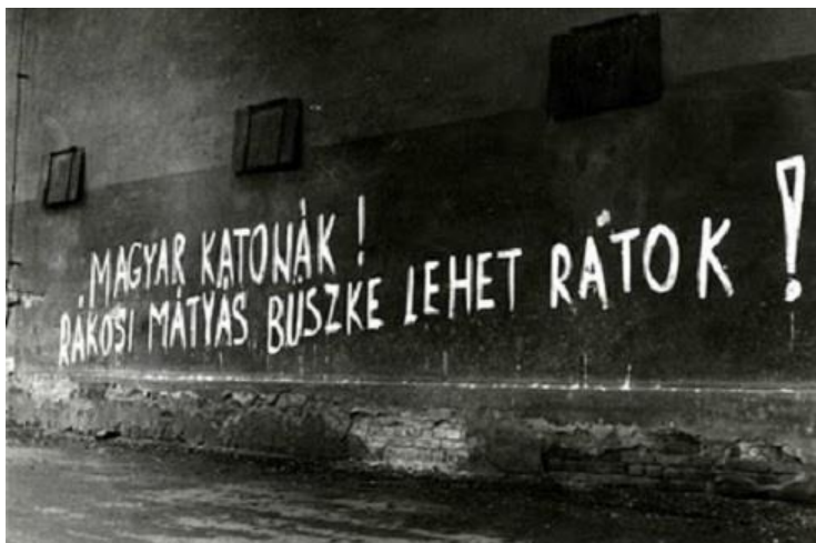
3. kép: A bevonulás utáni hetek, hónapok során rengeteg magyar, szlovák nyelvű felirat jelent meg a magyar alakulatok által ellenőrzött települések utcáin. Ennek egyik példája ez a kép is.

A lakosság részéről további inzultusok érték a magyar katonákat. Augusztus 22-én 12:00–13:00 között sztrájkot tartott a város lakossága. Aznap még több zavaró esemény is zajlott. Az esti órák folyamán több rendbontás is történt (jelszavak felfestése) amely során fegyverhasználat is bekövetkezett (3. kép). Ebből adódóan csehszlovák részről sérülés is keletkezett. Léván kívül Zarnvice 18 településen volt tüntetés. A következő napokban újabb feliratok jelentek meg a környező települések útjain és falain. 19