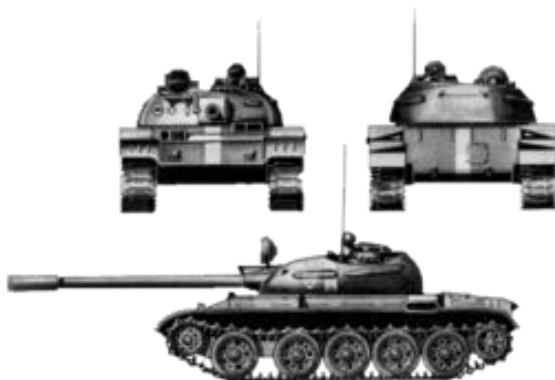
1. kép: A bevonulás során használt T-55 típusú harckocsi a bevonulás során használt megkülönböztető jelzéssel

A tervek kidolgozását az ezred parancsnok helyettese és az ezred törzse végezte. A feladat végrehajtásának két verzióját készítették el. A két verziót az alapján dolgozták ki, hogy ütköznek-e fegyveres ellenállásba, vagy sem. A hadműveleti terv megalkotása során 1:100000 és 1:200000 méretarányú térképeket használtak fel. A bevonulás során 65 km távú harci menetet határoztak meg az ezred számára. Úgy tervezték, hogy az ezred vezeti a bevonulást, az egységek szorosan egymást követik, ellátó alakulataik a harcoló alakulatoktól elszeparáltan haladnak, illetve végbiztosítást nem szerveznek a menet számára (1–2. kép). Az ezred feladata a következő volt: „Fő feladat: az objektumok gyors birtokbavétele, és a fegyveres erők tagjainak lefegyverzése, illetve ellenőrzés alá vétele. Az együttműködés megszervezése folyamán a fő figyelmet arra fordítottuk, hogy az egység fő feladatát, Léva város birtokbavételét, 3-4 óra alatt végre tudjuk hajtani. Ennek érdekében nagy gondot fordítottunk a híd átkelőhelyek, megsemmisítése esetén a gázló biztosítására, a felderítés és a menetbiztosítás alapos megszervezésére. Fegyveres ellenállás esetén a ellenálló góccok menet közbeni felszámolását szerveztük meg, nagyobb erejű ellenséggel való találkozás esetére pedig az ellenálló erők találkozó harcban történő szétverését határoztuk meg.” 6