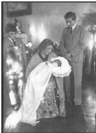
Forrás: Odescalchi 1987, o. n.

Az iskolában a növendékek az érdemjegyeknek megfelelően különböző színű szalagokat kaptak: „A zárdejában az érdemjegyeket havonta, minden első vasárnapon osztották ki. A jegyek minősége szerint vállunkra tűzve megkaptuk az ezekért járó szalagot. A fehérek jelentette a mindenben kitéűnő jegyet. A lila a nagyon jót, a zöld pedig a megfelelőt. Néha fehérek csokrot is