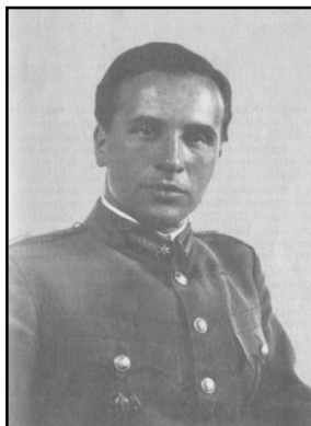
Forrás: Erba Odescalchi 1991, 15.