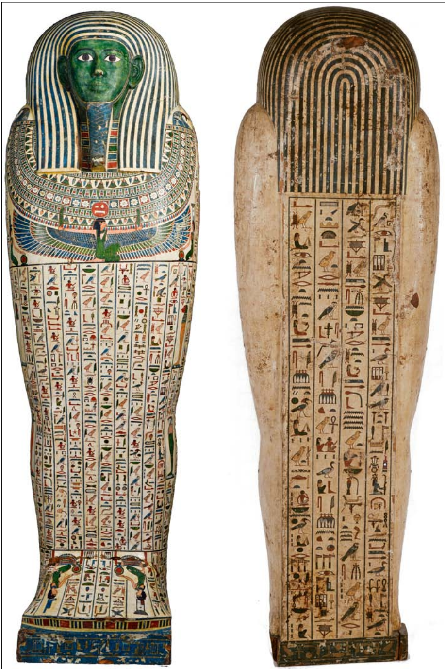
ÁBRA 1 Pefseuneith koporsójának elő- és hátoldala