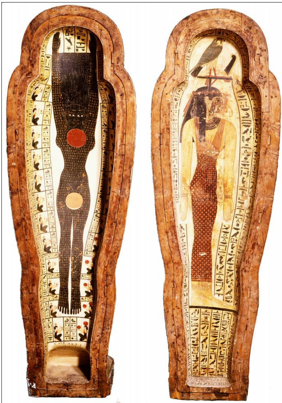
ÁBRA 2 Pestjauneith koporsójának belső dekorációja