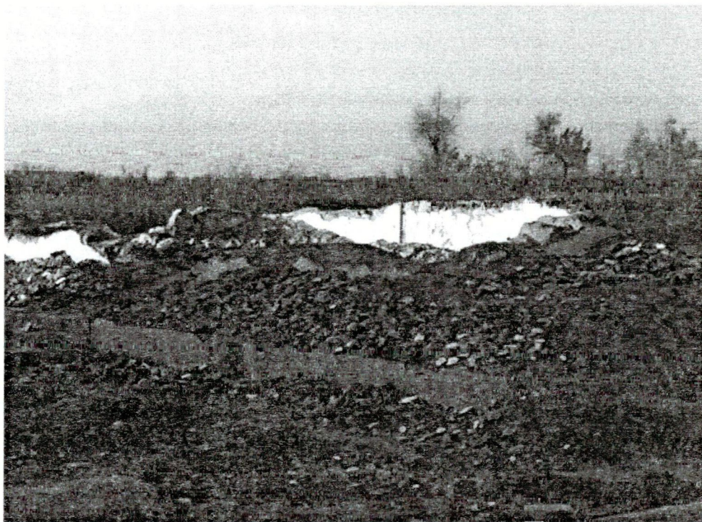
Egy falubeli „szocpol ház”

mind pedig a lakáskörülményekben. Tehát a romák a mellékutcákban laknak, közel a folyóhoz. A falu egyik ilyen leghosszabb mellékutcája a „cigánysor”. Régebben – még a romák tömeges beköltözése előtt – itt takaros, tiszta parasztházak álltak. Ez volt a település legszebb utcája. Ha most végigmegyünk rajta, nehéz ezt elképzelni. Nincs betonút, a házak omladoznak, a köznyelvben „szocpolnak” nevezett házak némelyikéről hiányzik az ajtó, az ablak, vagy éppen a tető egy része, holott ezek a házak nemrég épültek.