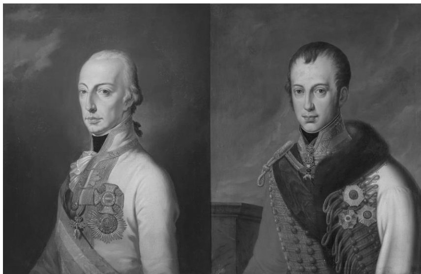
1. kép: Ferenc király (balra) és V. Ferdinánd (jobbra)

Tanulmányunkban a reformkori országgyűlések általános működését vizsgáljuk meg. Emellett példaként ismertetjük Csanád vármegye legfontosabb követutasításait az 1843/44. évi országgyűlésről. Végezetül a reformkori országgyűlések legfontosabb eredményeit mutatjuk be.