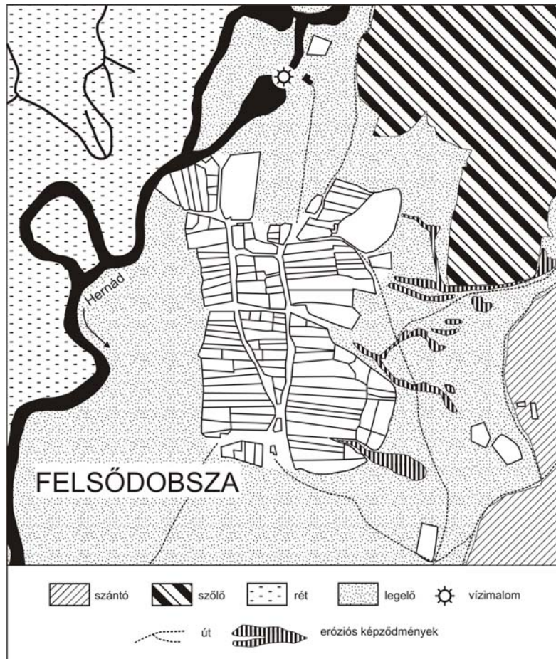
1. ábra Felsődobosza belsője a 19. század közepén. A Hernád magaspartja alatt elterülő belső keleti felét rendszeresen veszélyeztették a tömegmozgásos jelenségek (Kézirat alapján, egyszerűsítve – szerk. Dobány Z. )

tős gazdasági haszonnal járó távolsági kereskedelmet és fuvarozó tevékenységet egyre inkább háttérbe szorította a vidéken.