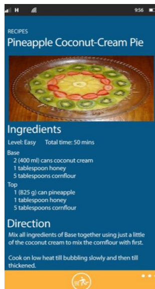
2. ábra. Receptek

Megspóroljuk neked azokat a hosszú órákat, amit a receptek után való kereséssel töltenél. Összegyűjtöttük egy helyre a kifejezetten ételérzékenyeknek szóló recepteket (2. ábra). Így több szabad időt kapsz, hisz ez egy „asszisztens” feladata, mint amilyen a LIA is.