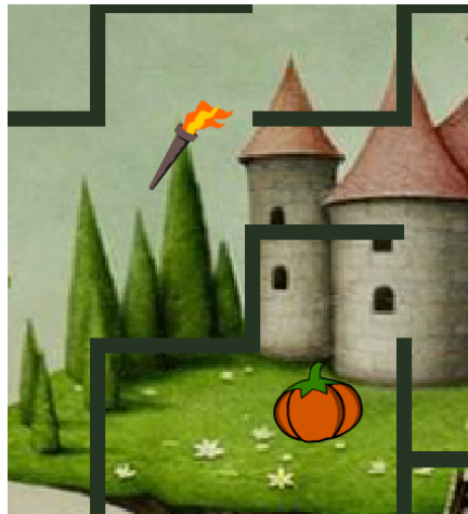
5. ábra. A segítő lehetőségek.