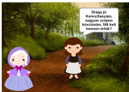
2. ábra. A párbeszéd

A 2. ábrán egy párbeszéd részlet látható a játék elejéről.