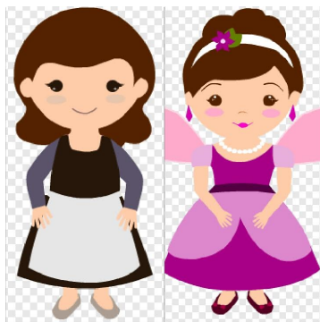
1. ábra. Sophie átváltozása

Az 1. ábrán látható Sophie kinézete a játék elején és miután a játékos végigment a pályán. Minden egyes jó válsz után egy új ruha az ajándék.