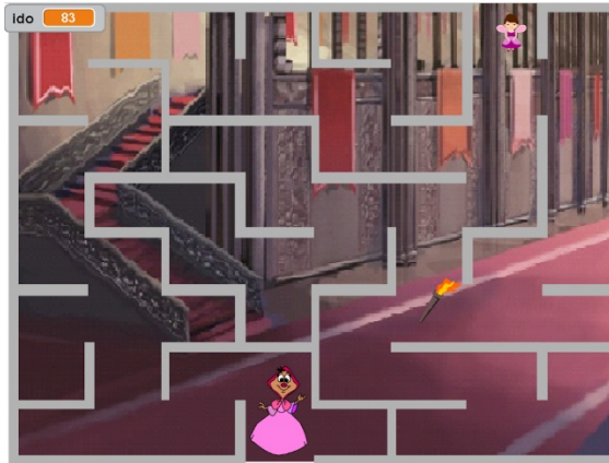
4. ábra. Labirintus

A 4. ábrán a labirintus egy részlete van.