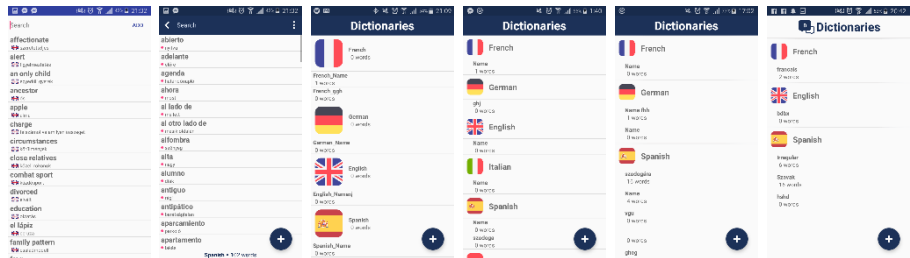
1.ábra. A program felhasználói felületének a fejlődése

A program fejlesztése rengeteg időbe telt/telik, jelenleg is fejlesztés alatt áll. Lassan három-négy hónapja dolgozom rajta. Az ábrákon (1) jól megfigyelhető az egyre letisztultabbá válása.