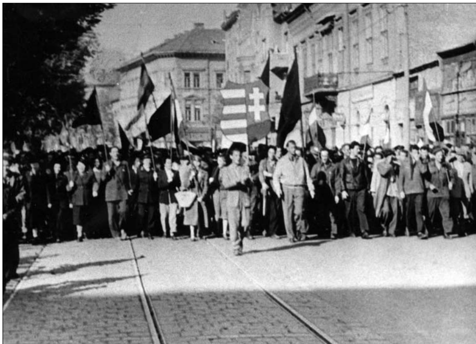
Szeged 1956. Fent: felvonulás (okt. 24.), lent: gyűlés a Klauzál téren (okt. 25.)