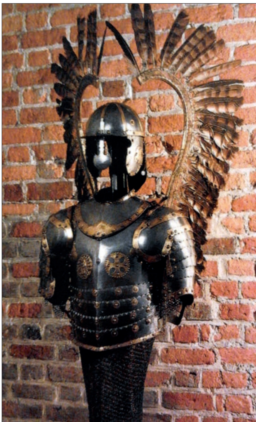
348. kép • Lengyel „szárnyas” huszár páncélja a XVII. század második feléből, Wawel, Krakkó ( https://commons.wikimedia.org/wiki/File:Poland_Half-armor_of_winged_cavalry.jpg alapján, 2017. január 1.)

alapvető prototípusok önálló fejlődésén nyugszanak. 1382 Ami a szarmata–germán kapcsolatokat illeti: ezek nyomai – ha meglehetősen szórványosan is – valóban fellelhetők mind a Przeworsk, mind a Wielbark, 1383 mind az alföldi szarmaták területén. E kapcsolat jellegének mélyebb tanulmányozása a jövő feladata.