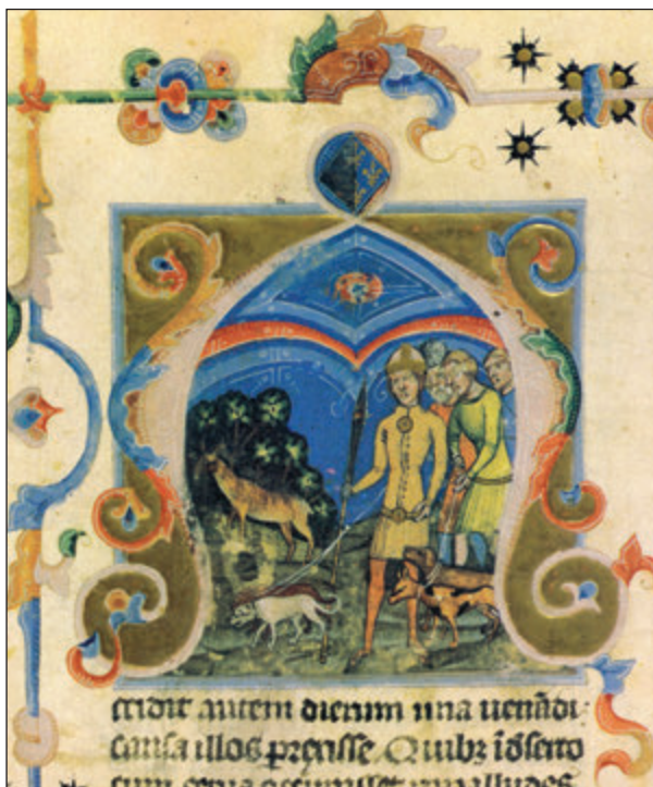
350. kép • Hunort és Magort vezeti a csodaszarvas (KÉPES KRÓNKA 5. lap)

Itt most a szarmaták tanulmányozásának szerepére a honfoglalás kori kutatásban ezt az egyetlen vonatkozást emeltük ki. Számptalan további aspektus vehető fel (a vallástörténeti kérdésektől, a motívumkutatáson keresztül az egyes régészeti leletekig). Mindezek részletes tárgyalása azonban szétfeszítené munkánk kereteit.