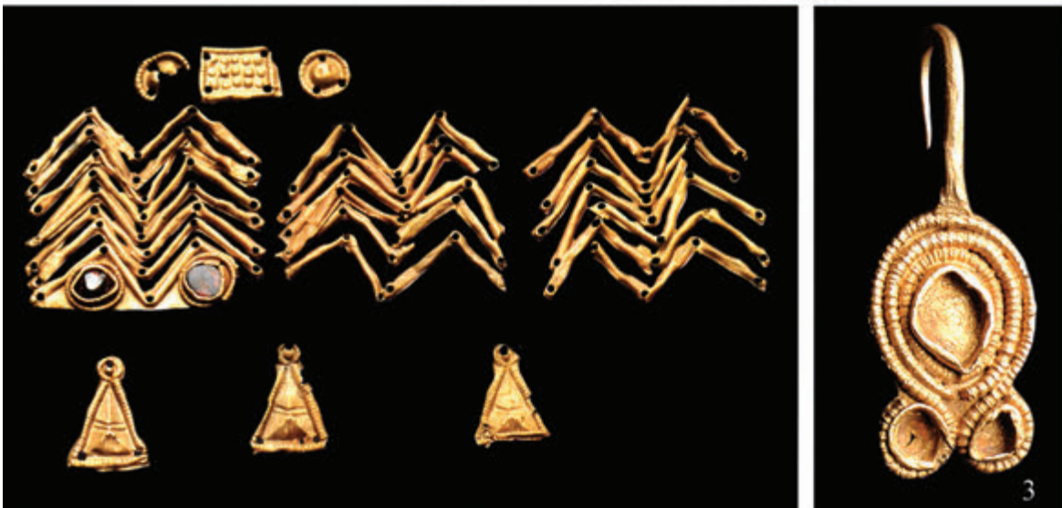
343. kép • A W alakú díszeket a kutatás igyekszik az alánokhoz kötni. Ilyenek kerültek elő a többi között 1: a krími Lucsisztojében, 2: a magyarországi Regölyben (BÓNA 1991. Taf. 15. alapján) vagy 3: a franciaországi Airanban (L'OR 2000. Kat.12.1. és 6. alapján)