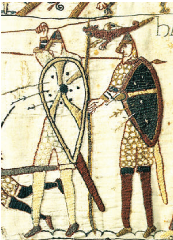
346. kép • Sárkányos zászló a Bayeux-i szőnyegen (GRAPE 1994. 164. alapján)