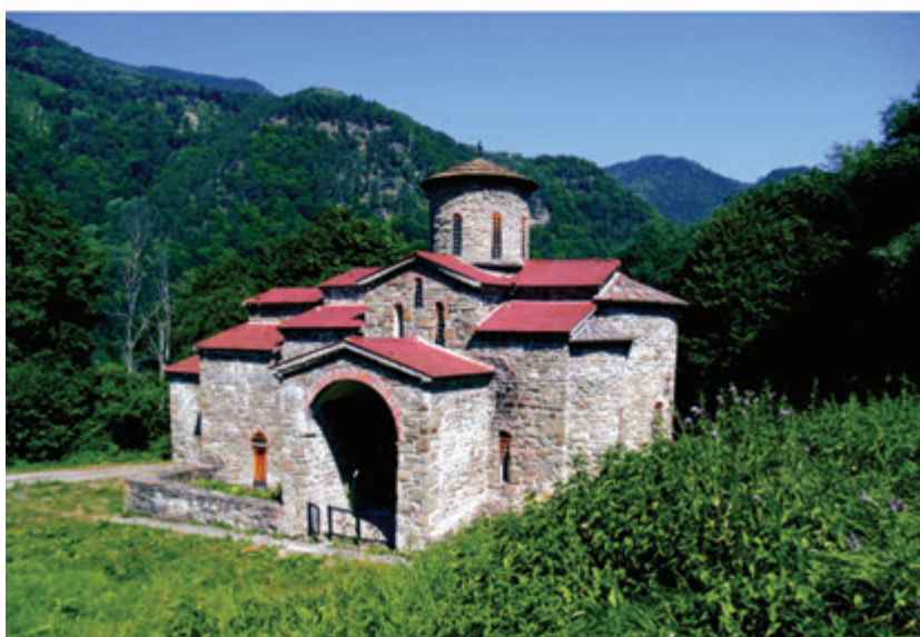
340. kép • X. századi templom az alánok fővárosának meghatározott Nyizsnyij Arhizban (Karacsáj- és Cserkeszföldön)

aztán bizánci hatásra Nyugat-Alánia hivatalosan felvette a kereszténységet. Az alán püspökség központja a székesegyházzal éppen a Nyizsnyij Arhiz-i erődített telep területén kapott helyet (340. kép). 1345