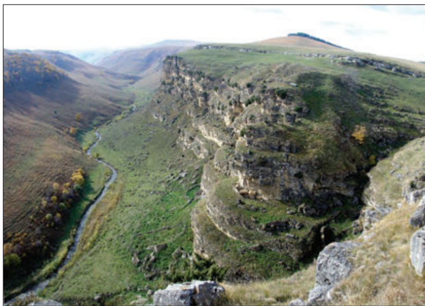
337. kép • Kicsmalka (Kiszlovodszki-medence) kora középkori alán földvár (KOROBOV 2012. Fig. 7: 2. alapján)

A kaukázusi alánok történetét az I. évezred második felében földrajzi elhelyezkedésük alapvetően meghatározta. Szállásterületük a Bizánci és a Szaszanida Birodalom érdekeinek kereszttüzében állt. Mindkét nagyhatalom igyekezett szövetségesei között tudni a kaukázusi átjárókat birtokló népet. Ennek fényében nem véletlen, hogy az alánok nyugat-kaukázusi területein a bizánciakkal való szövetség nyomait fedezhetjük fel, míg a keleti régió jelentőségét a Perzsa Birodalommal kialakított viszony adta meg. Mind a Szaszanida, mind a bizánci kapcsolatokra a régészeti anyag mellett a forrásokból is rendelkezünk adatokkal. Az