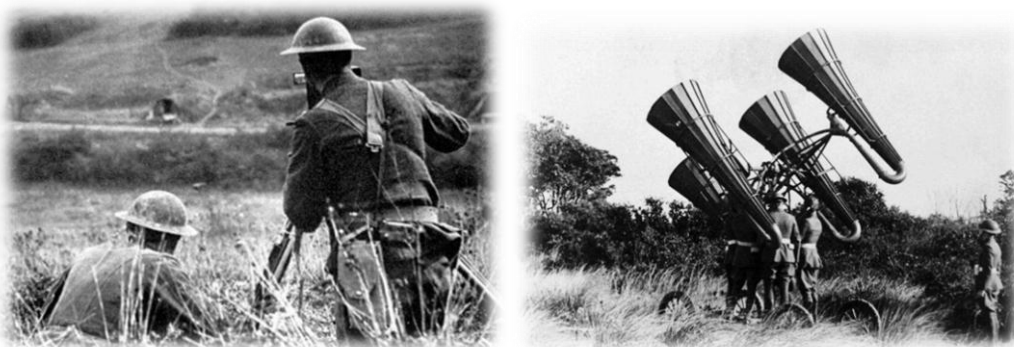
Amerikai tüzérségi megfigyelők (bal) 15. kép Amerikai katonák egy akusztikus lokátorral (jobb) 16. kép

Az általános, minden információhordozóra kiterjedő cenzúra-gyakorlat részeként önálló fotócenzúra is működött a front mindkét oldalán. 15 Elsősorban azoknak a képeknek a megjelenését tiltották, amelyeknek a valóságos szörnyűségek és embertelenségek demoralizáló, újoncokat elretentő, a háterszág szemét felnyitító hatásától tartottak. Az amerikai, francia és brit haderőnél az etnikailag sokszínű állomány esetében a rasszizmus-érzékeny asszociációkat kívánták elkerülni.