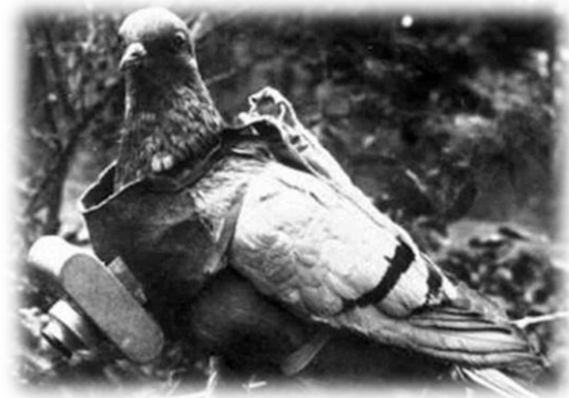
Galamb a fronton (bal) 1. kép Felderítő galamb a testére rögzített könnyű kamerával (jobb) 2. kép

Véleményem szerint két fejlemény érdekes egybeesésének köszönhetjük mindezt: a vizuális dokumentumok forrás-értékét tudatosító fordulatnak, illetve a gyűjteményezés és megosztás újfajta kultúrájának, amely a digitalizálás és a hálózati hozzáférés révén meglepő gyorsasággal alakult ki. Emiatt váltak hirtelen fontossá és megbecsültté a memóriaintézmények meglévő, de eddig csekély jelentőségűnek tartott kollektívái, 2 és nőtt meg a kereslet a magánkézben lévő „amatőr” kép-állomány feltárása, megmentése és közkinccsé tétele iránt. 3