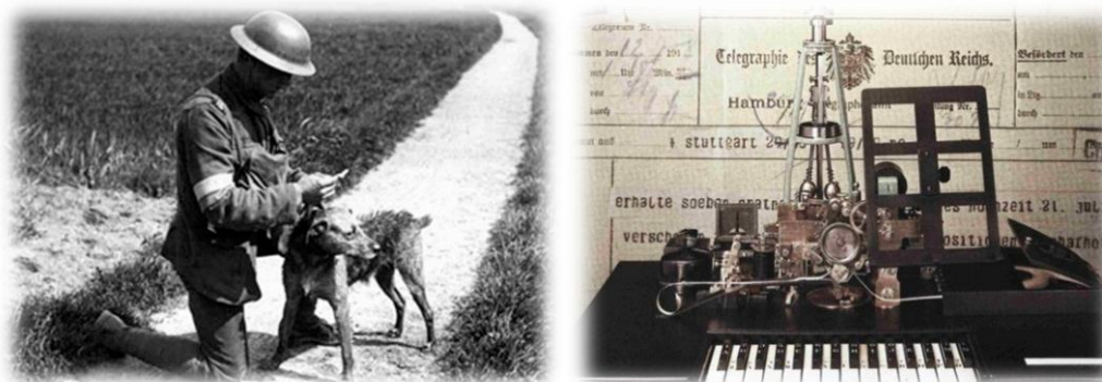
Üzenethozó kutya (jobb) 9. kép Hughes típusú betűíró távíró 10. kép

A világháborút megelőzően alig egy évtized állt rendelkezésre, hogy a fényképezés kiszabaduljon a műtermek falai közül és bárki számára elérhetővé váljon. A hatalmas mennyiségű