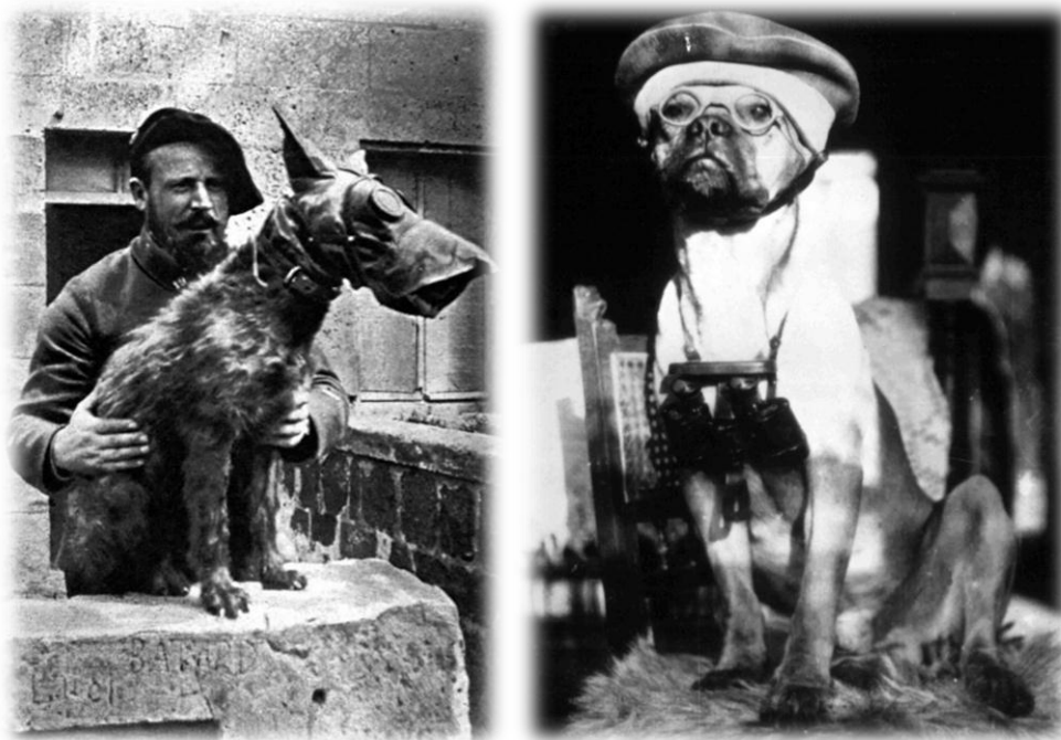
Gázmaszkos hírvivő kutya Franciaországban (bal) 21. kép Német felderítő kutya (jobb) 22. kép

Az informatíótörténelem, az információs jelenségcsalád fogalmi keretrendszerén belül megragadható kutatói kérdésekkel foglalkozó történeti irányzat és szemléletmód nagyon rövid múltra tekinthet vissza (Z. Karvalics, 2004 újabban: Z. Karvalics, 2012), és szöveghagyományában, egyetlen felvetéstől eltekintve, eddig nem is született olyan megközelítés, amely az első világháború és az informatíótörténelem közös metszetét kereste volna.