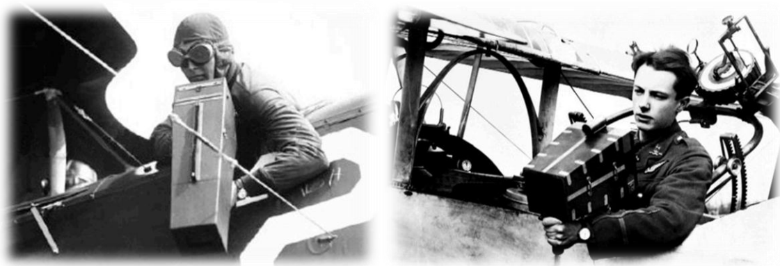
Légi kamera (bal) 11. kép Angol légi fotós (jobb) 12. kép

A frontra küldött vagy engedett fotóművészek mellett a háború szülte meg a hivatásos hadifotóst, mint szakmát. Egyedül a német hadsereg majd félezer profi fényképészt állított csatasorba (Kolozsi-Szémann, 2014). A Monarchia hadseregében ennél jóval kevesebb magyar hivatásos szolgált, de éppen ezért a történelmi kutatás majdhogynem személyes ismerőssé tudta tenni a legjelentősebbeket: Jelfy Gyulát, az elsőt, a világhírnévig jutó Balogh Rudolfot, 8 a másodikat, majd Nádas Sándort, Vydareny Ivánt és sorra