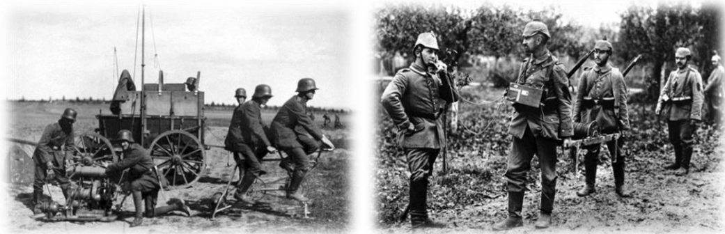
Német kommunikációs csapat (bal) 17. kép Telefonáló német katonák (jobb) 18. kép

Számos, látszatra ártalmatlan fénykép tartalmazhatott az ellenség számára jelentéssel bíró információt (egy új fejlesztésű repülőgép, egy kézitusá-technika, a tiszt páncele formája, álcázott kézigránátok típusai). Egy csapatszállító hajón készült vidám felvétel a hajózási útvonalak veszélyesebbé válását okozhatta volna. Néhány kép módot adhatott volna arra, hogy az ellenség kifigurázzon, nevetségessé tegyen valamit. Ezeknek az információs veszélyeknek a cenzúrával idejekorán elejét lehetett venni.