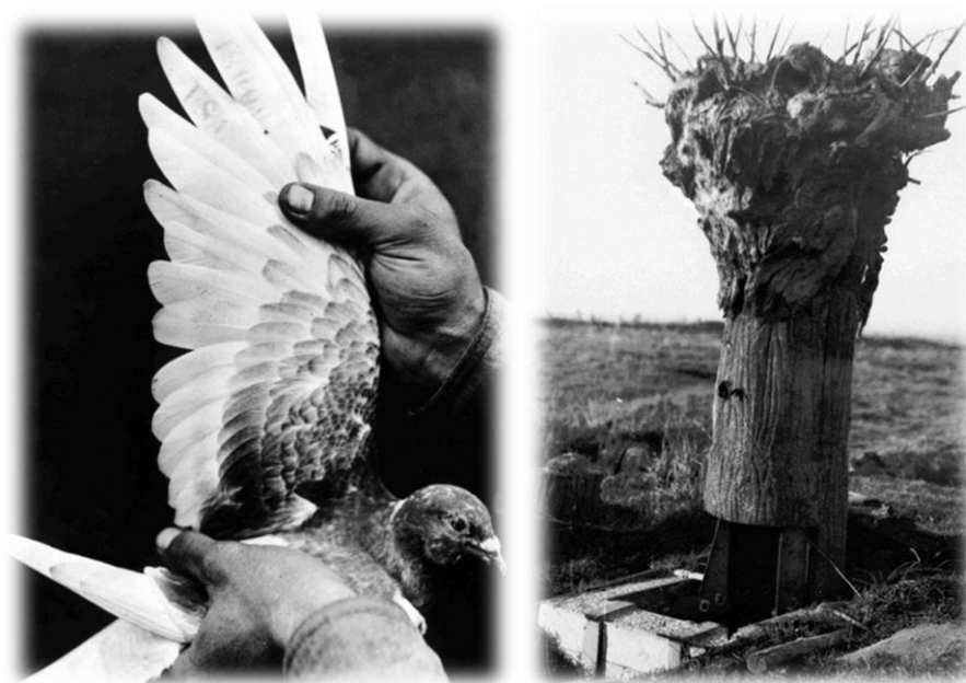
Sorszámított amerikai hírvivő galamb (bal) 7. kép Hamis fa, brit megfigyelő állomás (jobb) 8. kép

Ha a szórvány-előfordulások és rész-feldolgozások után valaki valóban történeti szintézisre vállalkozna, fél tucatnyi, jól elkülöníthető, különböző kutatási stratégiát és felkészültséget igénylő témáról kellene egyidejűleg illetve összefüggéseiben számot adnia. (A szempontokat épp csak felvillantjuk, majdani kutatások inspirálásának szándékával).