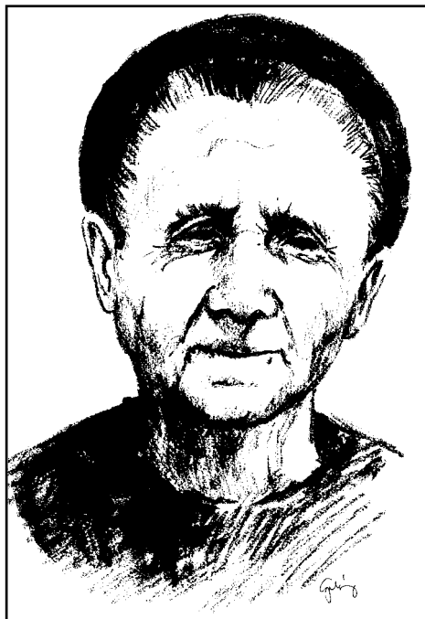
Gubányi Eszter grafikája

A Maryland-i Fellebbezési Bíróság csakis ezen utóbbi kifogás alapján, a híres Brady versus State precedensre hivatkozva állapította meg, hogy az eljárást hatályon kívül