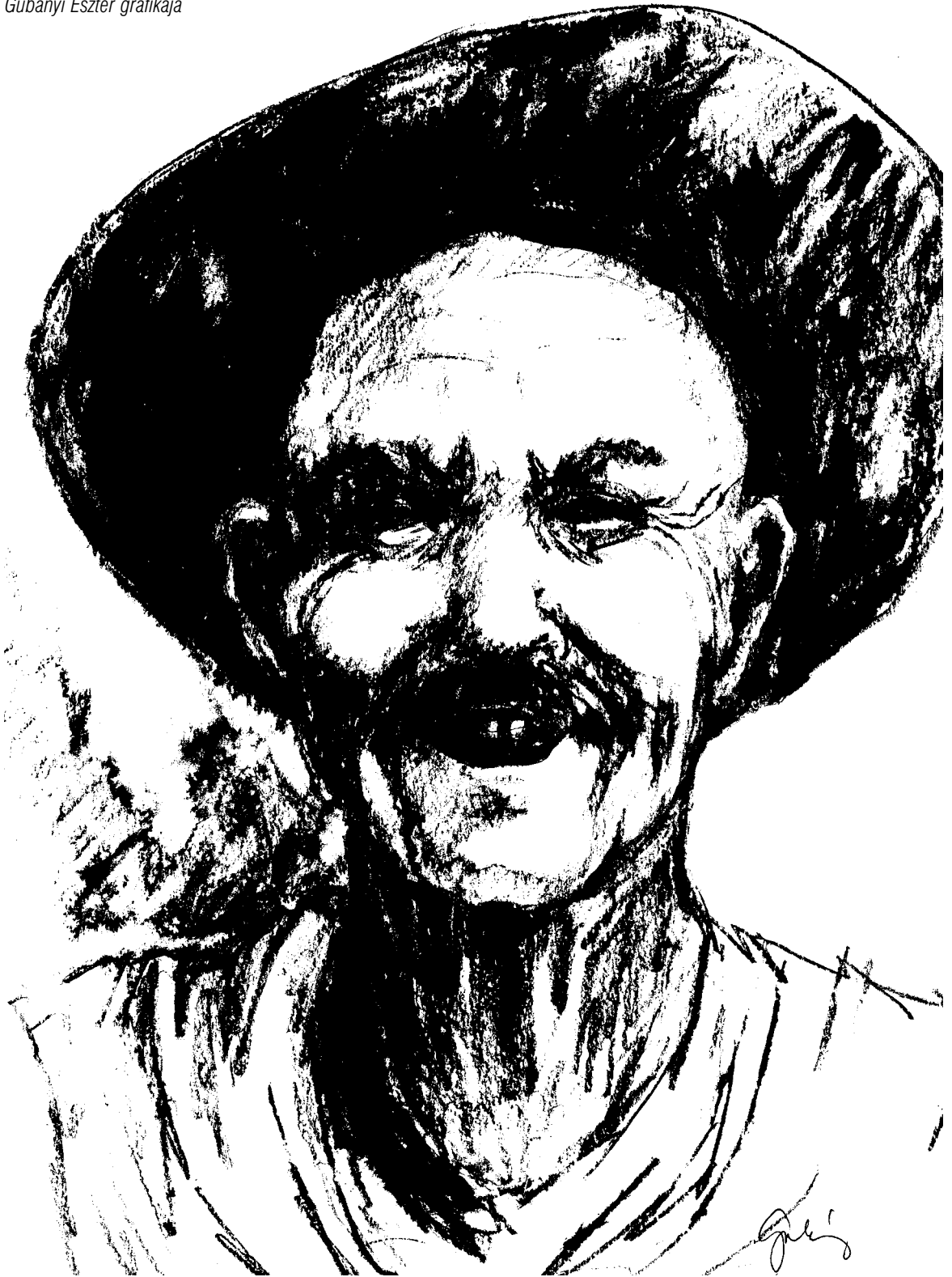
Gubányi Eszter grafikája