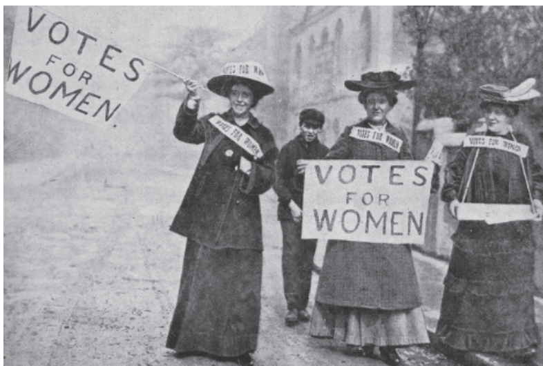
1. kép: Tüntető nők 7

Más országok helyzetére is kitekintve, míg Törökországban már az 1930-as években szavazhattak a nők, addig az Öböl-menti országokban egészen a 21. századig kellett arra várni, hogy a férfiakkal azonos szavazati jogok illessék meg őket. Legutóbb 2006-ban a sokáig kitartó Egyesült Arab Emírségek biztosította a jog gyakorlását a nők számára, így Szaúd-Arábia magára maradt egyedüli muszlim országgént, ahol nem szavazhatnak nők. A legmegdöbbentőbb Svájc, ahol 1971-ig kellett várni. Ekkor a szavazásra jogosult férfiak kétharmados többséggel úgy határoztak, hogy elfogadják a szövetségi alkotmánynak a kormány által is javasolt módosítását és a nyugat-európai polgári demokráciák közül utolsóként megadták a nőknek a szavazás jogát. Az eredmény automatikusan megváltoztatta az alkotmányt. A nők 1971. október 30-án szavazhattak először.