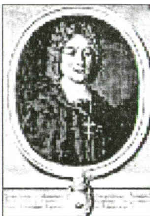
Georg Muffat (1653–1704)

„A Salzburgi Zene Emlékművei” 1 kiadó publikációsorozata egy olyan művel is foglalkozik, ami a salzburgi érsekség udvarának egyik különlegessége. Az eddig még szinte egyáltalán nem ismert műről és komponistáról tesz említést, aki a 17. század második felében Európa egyik legjelentősebb muzsikusa volt.