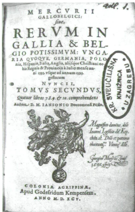
Listi II. János possessorbejegyzése