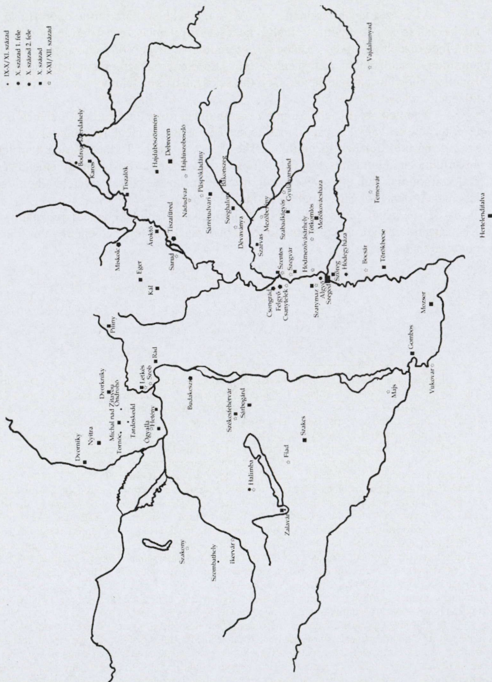
2. térkép: IX–XI. századi temetők