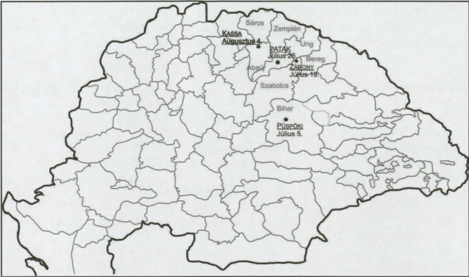
1. térkép: A nádori közgyűlések időpontjai és helyszínei 1334-ben.