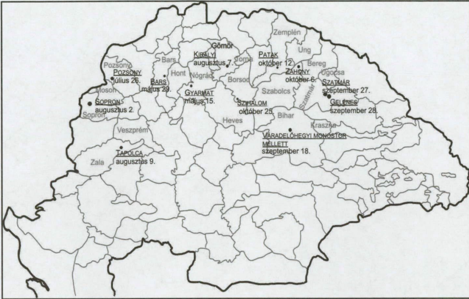
2. térkép: A nádori közgyűlések időpontjai és helyszínei 1336-ban.