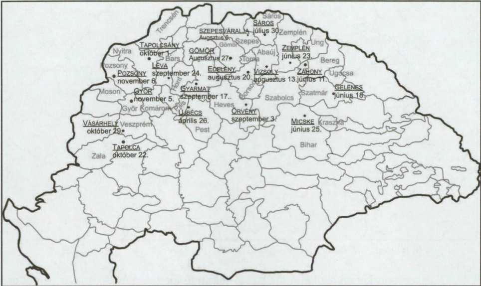
5. térkép: A nádori közgyűlések időpontjai és helyszínei 1341-ben.

megtehetett a nádor, így valószínű, hogy az alnádor maradt helyette Győrben, aki lefolytatta a közgyűlést.