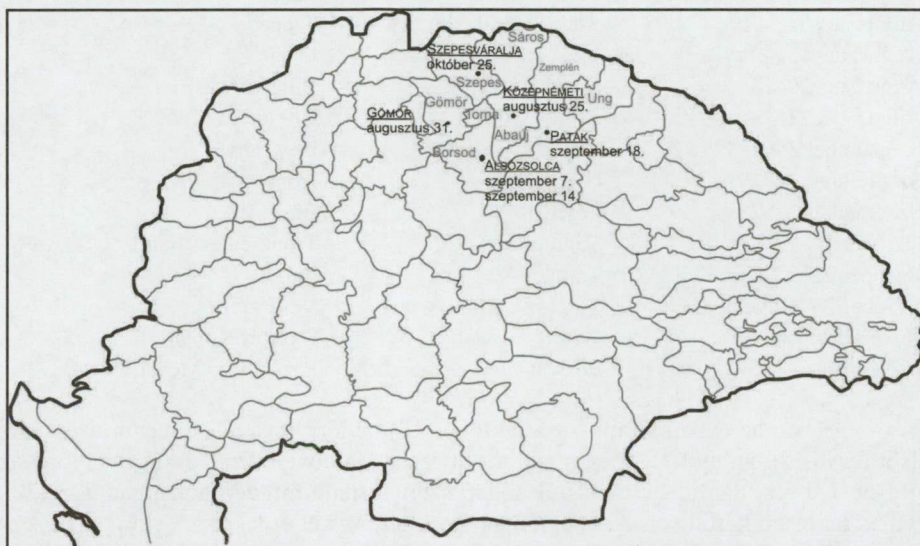
4. térkép: A nádori közgyűlések időpontjai 1339-ben.

1339-ben az első közgyűlés megtartására már az év második felében, augusztus 25-én kerül sor, míg az utolsót október 25-én nyitja meg a nádor. Ez idő alatt mindössze néhány megyét járt be.