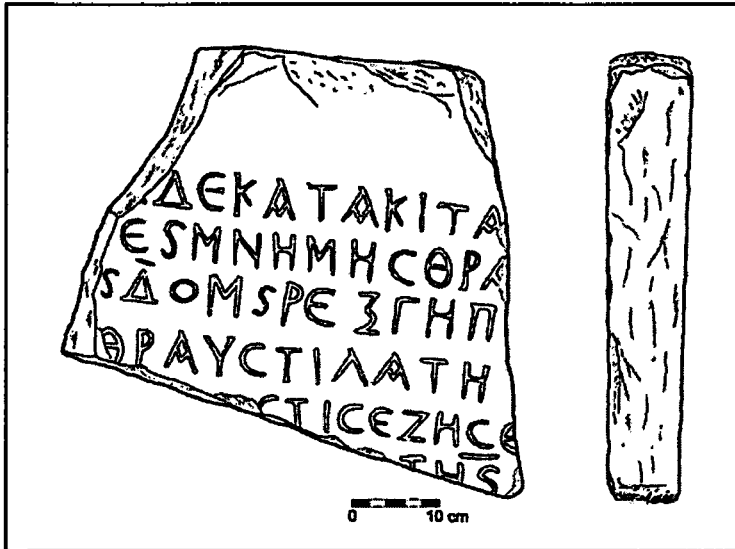
1. kép: A „Thrasaric-felirat