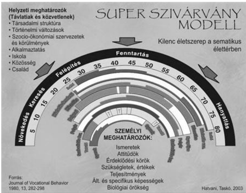
1. ábra Super életpálya-szivárvány. 9 életszerep a sematikus élettérben

Super szivárvány modellje az egész életét, életpályát próbálta átfogni, amelynek a munka csupán egy szelete. Ezek szerint életpályánk nyolc szerepből (gyerek, tanuló, szabadidős tevékenység, polgár, dolgozó, házastárs, háztartást fenntartó, szülő) épül fel. Azt, hogy ezek a szerepek hogyan valósulnak meg, külső és belső tényezők együttesen határozzák meg. A külső tényezők közé a szocioökonómiai környezetünk, belső tényezők közé attitűdjeink, érdeklődéseink, képességeink stb. tartoznak. Ahogy az életkorunk változik, úgy természetesen az egyes szerepek jelentősége is változik. Az, hogy mennyire vagyunk elégedettek az életünkkel, döntően attól függ, hogy ebből a nyolcból hány szerepünk van egyszerre, és hogyan, milyen szinten sikerül betöltenünk azokat (Borbély-Pecze – Répáczki – Kovács, 2010:15).