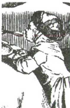
8. Chodowiecki: A főbb élelmiszerek (I. tábla) (részlet)

A Chodowiecki-rajz kinagyított részletén jól látható a német nyelvben „Fallhut”-ként ismert fejfedő: