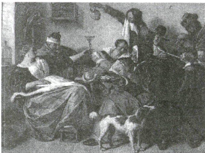
6. Jan Steen: Ahogyan az öregek énekelnek... (1663-1665)

Maga a téma nem előzmények nélkül való a festészetben – fennmaradt többek között Hieronymus Bosch , az idősebb Peter Bruegel és Jacob Jordaens hasonló című képe. Steen humoros-kedélyes családi jelenete egy olyan örök kérdést vet fel a festészet eszközeivel, amely abban a korban éppúgy foglalkoztatta az embereket, mint napjainkban: Vajon az ember jellemét az öröklés határozza meg, vagy pedig a nevelés és a környezet? A 16-17. század moralista szerzői és pedagógiai írói egyre többször figyelmeztetik a szülőket alapvető kötelességükre: saját életmódjukkal követésre méltó példát kell nyújtaniuk gyermekeiknek, hiszen azok utánozzák a felnőttek viselkedését. Steen a példaadás és utánzás mozzanatát ragadja itt meg – meglehetősen fonák módon. Az apa ugyanis – aki nem más, min ő maga – kibújik a tradíciók által diktált megállapodott és szigorú atya szerepéből. Helyette játszópajtása lesz gyermekének, akit a felnőtté válás felé vezető út egy sajátos rítusaként – játékosan ugyan de mégiscsak – pipázni tanít. Amíg az apa távolítja magától hagyományosan autoriter szerepét, a nagyapa átvenni látszik azt: legalábbis erre utal fején a fiatal apák szokásos viselete, a díszes sapka ( kraamherenmuts ). A festő gúnyos szeptecizmussal foglal állást az öröklés versus nevelés-vitában: a családban látott fonák példák (mulatozás, ital, dohányzás stb.) ellenére a gyerekekből – feltehetően – mégis ép és egészséges felnőtt lesz.