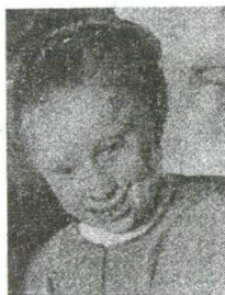
4. Jan Steen: A büntető tanító (1663-1665) 5. Jan Steen: A büntető tanító (részlet)