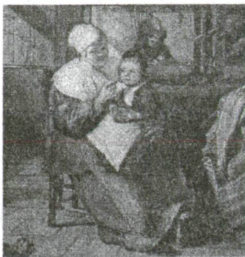
Isaak Koedijk (1617/8-1668?): Takácsműhely

Koedijk kortársa, Jan Steen (1626-1669) leideni festő képein gyakran látunk gyerekeket. Steen a németalföldi festőknek abba a csoportjába tartozik, akiknek tehetsége különösen a hétköznapi jelenetek megkapó ábrázolásában nyilvánult meg. (E tekintetben Rembrandt és van Hals nevével szokták együtt emlegetni.) Szívesen ábrázolja az élet visszásságait, jót mulat az emberi gyarlóságokon. Fogékonysága a humor, a komikum iránt Molière stílusára emlékeztet. Derűs életszemléletét nem vesztette el, noha az élet nem mindig volt kegyes hozzá: festői pályafutását többször fenyegette az anyagi csőd. (Időnként – apja foglalkozását követve – még sörfőzőként és kocsmárosként is szerencsét próbált.)