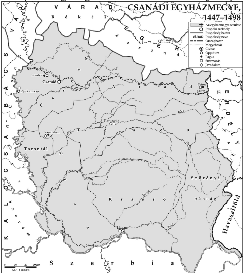
1. térkép A csanádi egyházmegyes klerikusok azonosított származási és szolgálati helyei

Az említett egyháziak szentelését összesen három, Rómában rezideáló püspök végezte. Ők általában csekélyebb bevételt garantáló, sok esetben csak tituláris egyházmegyék élén álltak, s a kúriai ordináriusi feladatok ellátásáért a 15. század derekától díjazásban részesültek. Az erre utaló, általam ismert első adat Radulf Ágoston-rendi remetére, Città di Castello püspökére (1441–1460) vonatkozik, akinek 1448. június 20-án utaltak ki hat forint havi