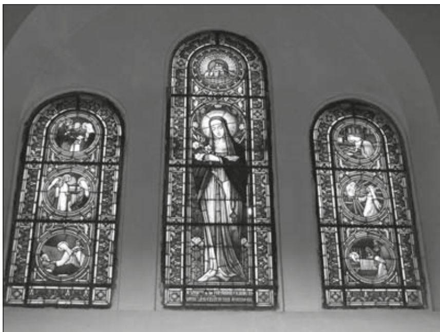
Margit a szegedi dóm üvegablakán