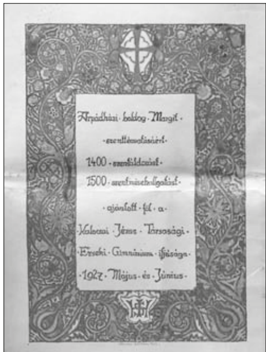
Szentáldozások felajánlása gyűjtőíve