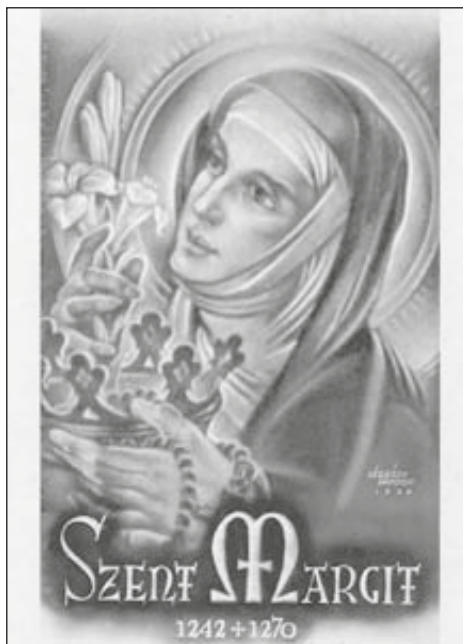
Képeslap, a propaganda eszköze