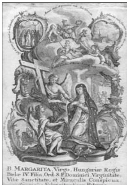
Boldog Margit, 18. századi metszet