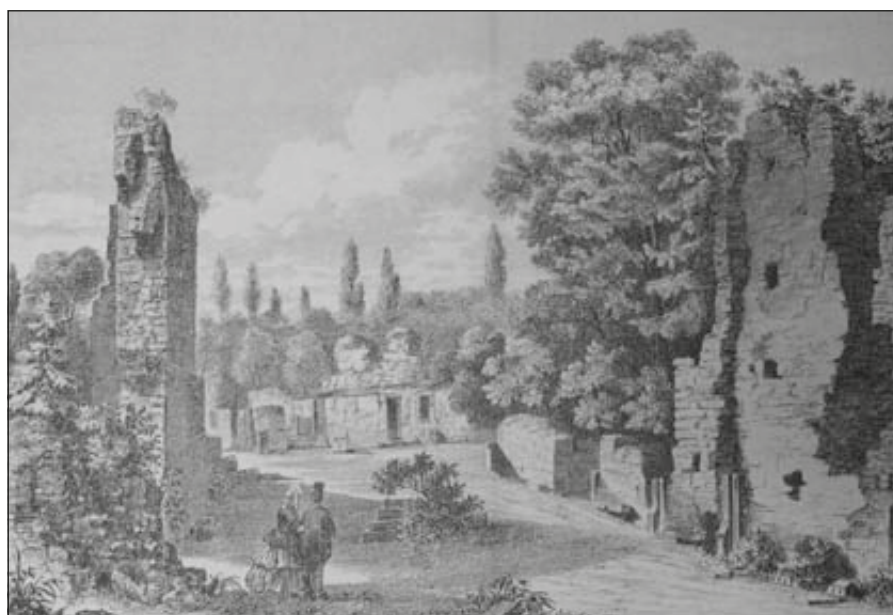
A margitszigeti romok, 19. századi metszet