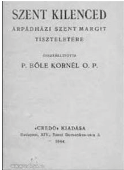
Kilenced Szent Margit tiszteletére, 1944.