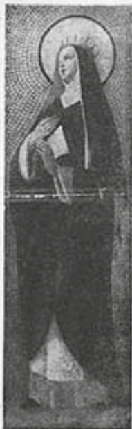
Árpádházi Boldog Margit, a helyőrségi érettségi!

A Nagyméltóságú Püspöki-Kar jóváhagyásával kérjük magyar hazának minden katolikus asszonyát és leányát, rajtuk át pedig a családokat, hogy egymillió szentmise-hallgatást szentáldozással ajánljanak föl Árpádházi Boldog Margit mielőbbi szenttéavatásáért.