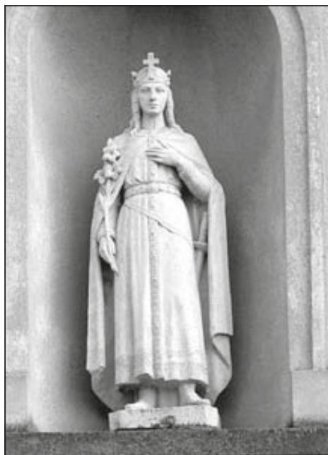
Szent Margit szobra, Pereg