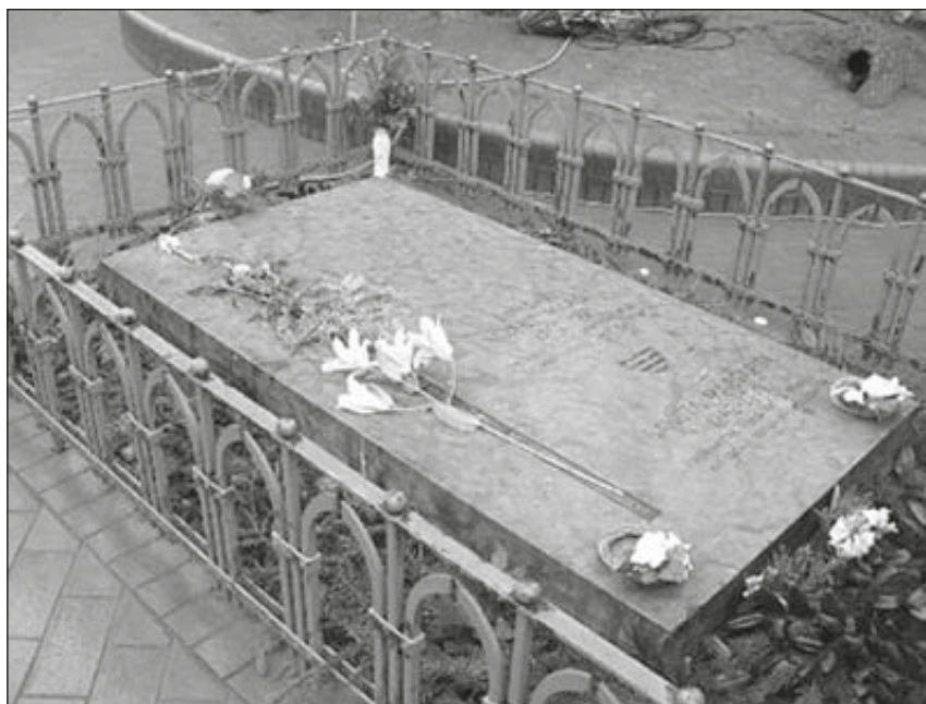
Szent Margit sírja a Margitszigeten