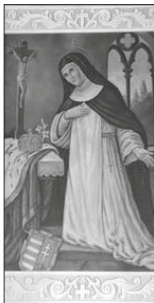
Boldog Margit attribútumaival, 19. századi kis szentkép