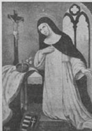
Apátság Szent Margit. — Felállítás a szent Dömökösökön kölkösökön.

Ez a csodálatos hémőng, ez az éntelvényés, ez a kőkös-szent és hódolónak hódolati a magyarr király, csaldón le. Liliomos szent feltek hódolati Szent Dömökös febró gyógyítót.