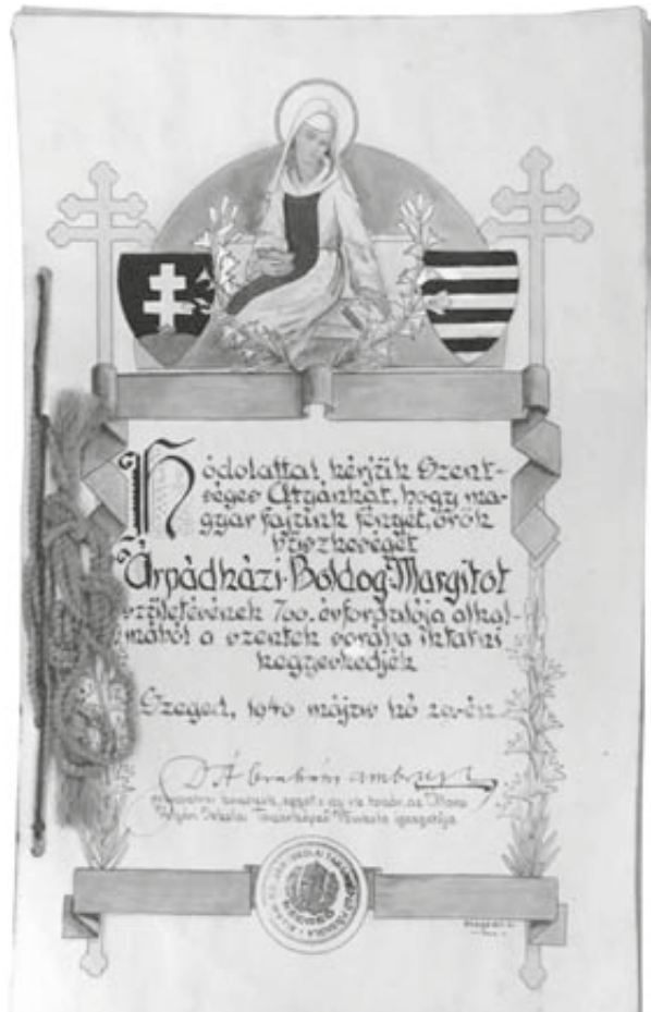
A szegedi tanárképző főiskola díszes folyamodványa a Szentszékhez